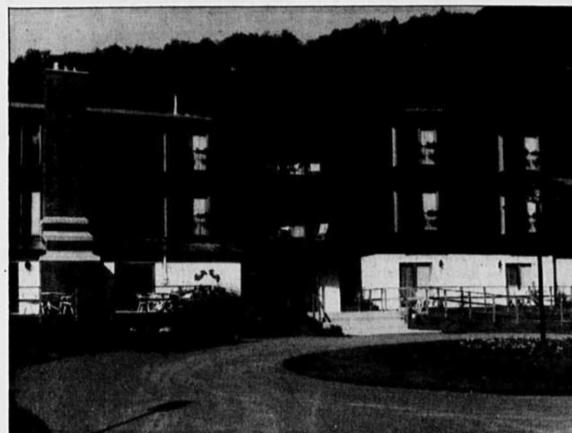
L'Eau à la bouche.

PRENONS UN LIEU, les Laurentides de Montréal, et deux thèmes de voyage, la bouffe et les idées préconçues, et faisons une panachée. La région d'abord. Les Laurentides sont aux portes de la grande métropole. Presque sans son aire d'extension naturelle, tant les liens entre les deux sont continus et étroits. Grâce au cordon de l'autoroute, lacs, montagnes et verdure sont à une heure à peine des premiers ponts de l'île. Si près, si accessibles, les Laurentides sont devenues une espèce de terrain de jeux des Montréalais qui se les ont plus ou moins appropriées par la villégiature et la pratique d'une vaste gamme d'activités sportives et culturelles. Pour tout dire, les Laurentides constituent maintenant pour eux un milieu familier qu'ils fréquentent sans s'attendre à y trouver exotisme ou matière à de grandes surprises.