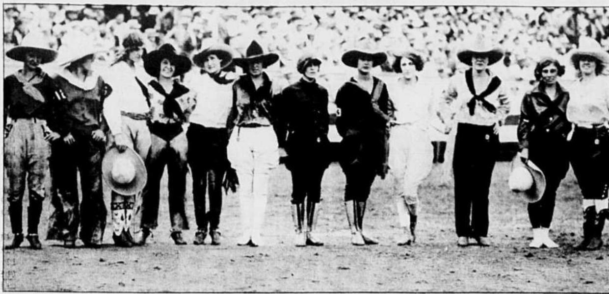
Prise en 1905, cette photo de princesses indiennes et cow-girls illustre un des stéréotypes de la frontière. À la galerie Oboro.