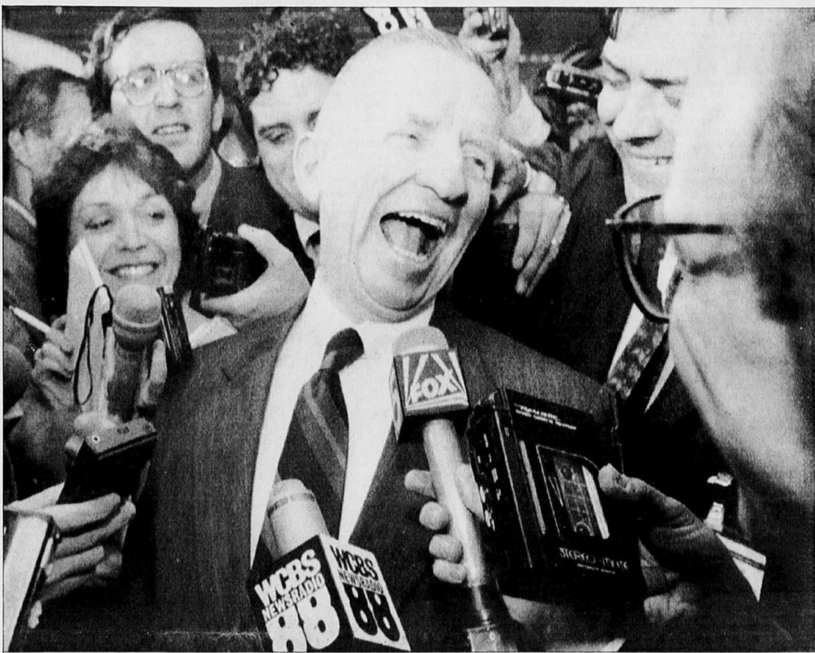
Ross Perot, le trouble-fête milliardaire de la campagne présidentielle américaine.

Au Texas, quelques mois plus tard, des milliers de ses partisans « spontanés » ont marché dans la rue à Austin, allant porter les listes des 225 000