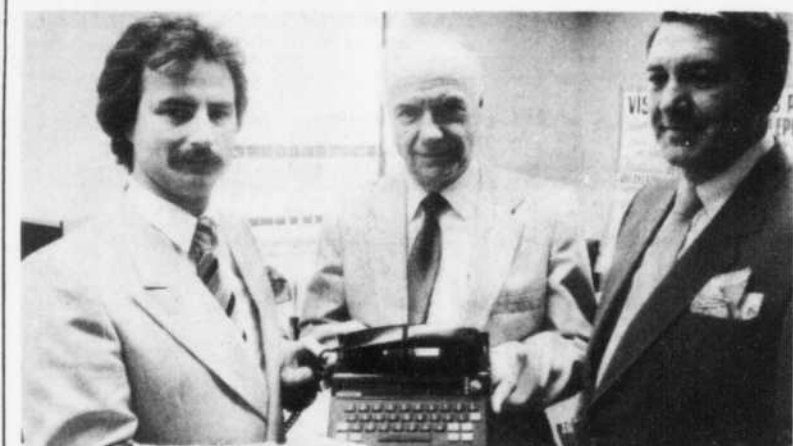
Don à l'hôpital