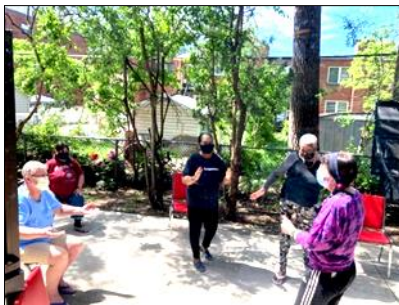
Zumba avec YMCA du Parc, cour de HLM Goyer

Dès la réception de permission d'organiser les activités collectives dans les parcs, les cours intérieures des HLM, nous avons commencé d'offrir des activités extérieures dirigées soit par les intervenantes, soit avec le YMCA : Marche et Yoga dans le parc, Zumba sur chaise, Yoga sur chaise, Bingo, Viactive et Le GO pour bouger ont fait tellement de bien à nos aînés.