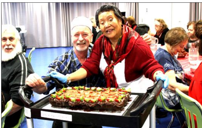
Activité des repas communautaires

La grande région métropolitaine de Montréal est passée en zone verte, et en plus c'est l'automne, saison de la rentrée ! La vaccination se poursuit un peu partout et le ciel semble se dégager peu à peu nous permettant d'espérer un retour progressif à la normale. Le moment idéal de s'écouter, de bouger et d'essayer du nouveau nous donne envie de faire du sport, des activités, etc... ! Savourons notre liberté retrouvée en participant aux activités offertes par le Centre des Aînés Côte-des-Neiges qui vous propose donc des cours et activités selon la situation sanitaire permise.