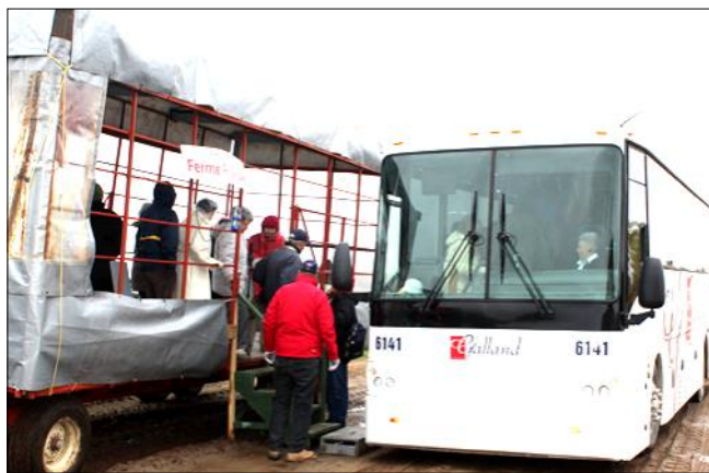
Excursions Hors-Montréal en autobus

Durement touché par les conséquences sanitaires et sociales de la pandémie (COVID-19), votre Centre a besoin de vous. Grâce à vos participations aux activités, à vos dons et au soutien de ses partenaires , le Centre des Aînés Côte-des-Neiges projette d'insérer dans la future programmation de nouvelles activités.