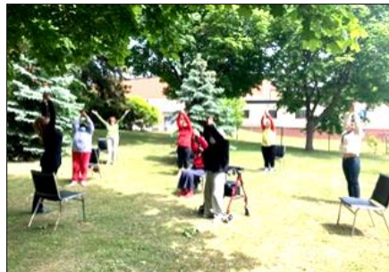
Yoga sur chaise avec YMCA du Parc, cour de HLM Isabella