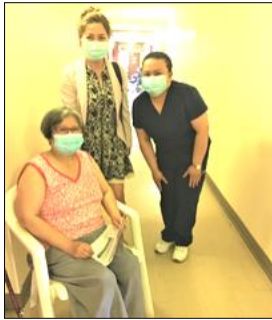
Clinique de vaccination, HLM Place Lucy

Grâce à la collaboration avec le CIUSSS Centre-Ouest-de-l'île-de-Montréal, les aînés des habitations Côte-des-Neiges, Goyer, Isabella, Plamondon, Place Lucy et Place Newman ont reçu leur 2 e dose à la clinique de vaccination dans leur milieu de vie. Ceux qui ne pouvaient pas la recevoir sur place, nous les avons référés par des prises de rendez-vous aux cliniques de vaccination externes. Notre présence les a beaucoup réconfortés, disent-ils, surtout nos aides à la décision de recevoir la 2 e dose les ont rassurés.