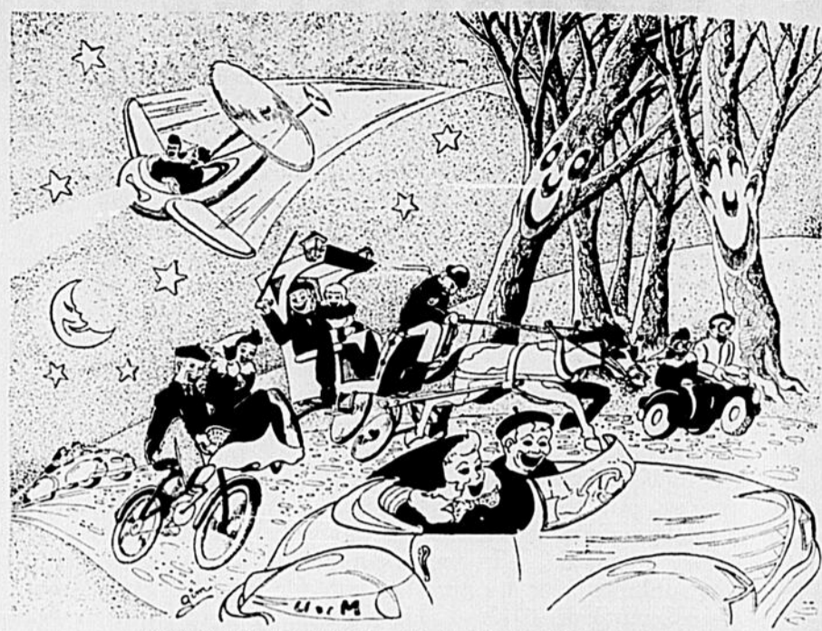
TOUS AU GALA, LE 23 NOVEMBRE!

Il n'en faut pas tant pour exaspérer. Faut-il s'étonner que les victimes se