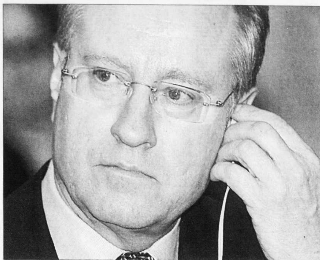
Le ministre de la Défense, Art Eggleton, a comparu devant ses pairs hier afin de s'expliquer sur ses déclarations contradictoires au sujet de prisonniers que les soldats canadiens ont faits en Afghanistan.