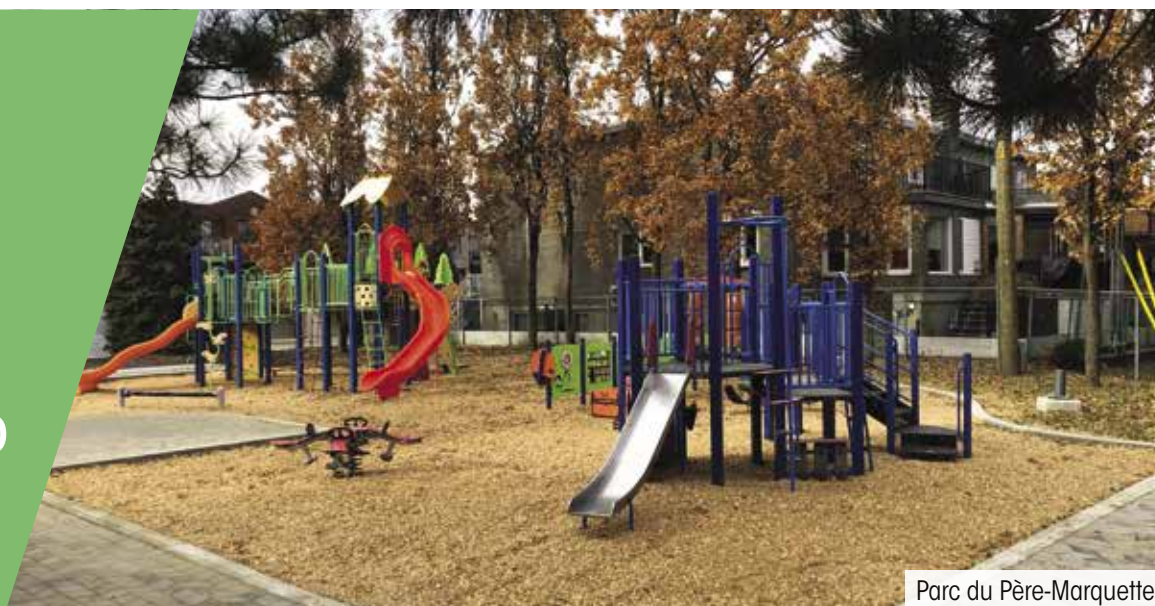
Parc du Père-Marquette

L'arrondissement a mis la touche finale à certains projets à la fin de l'année 2020.