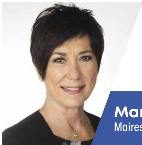
Manon Barbe Mairesse / Mayor