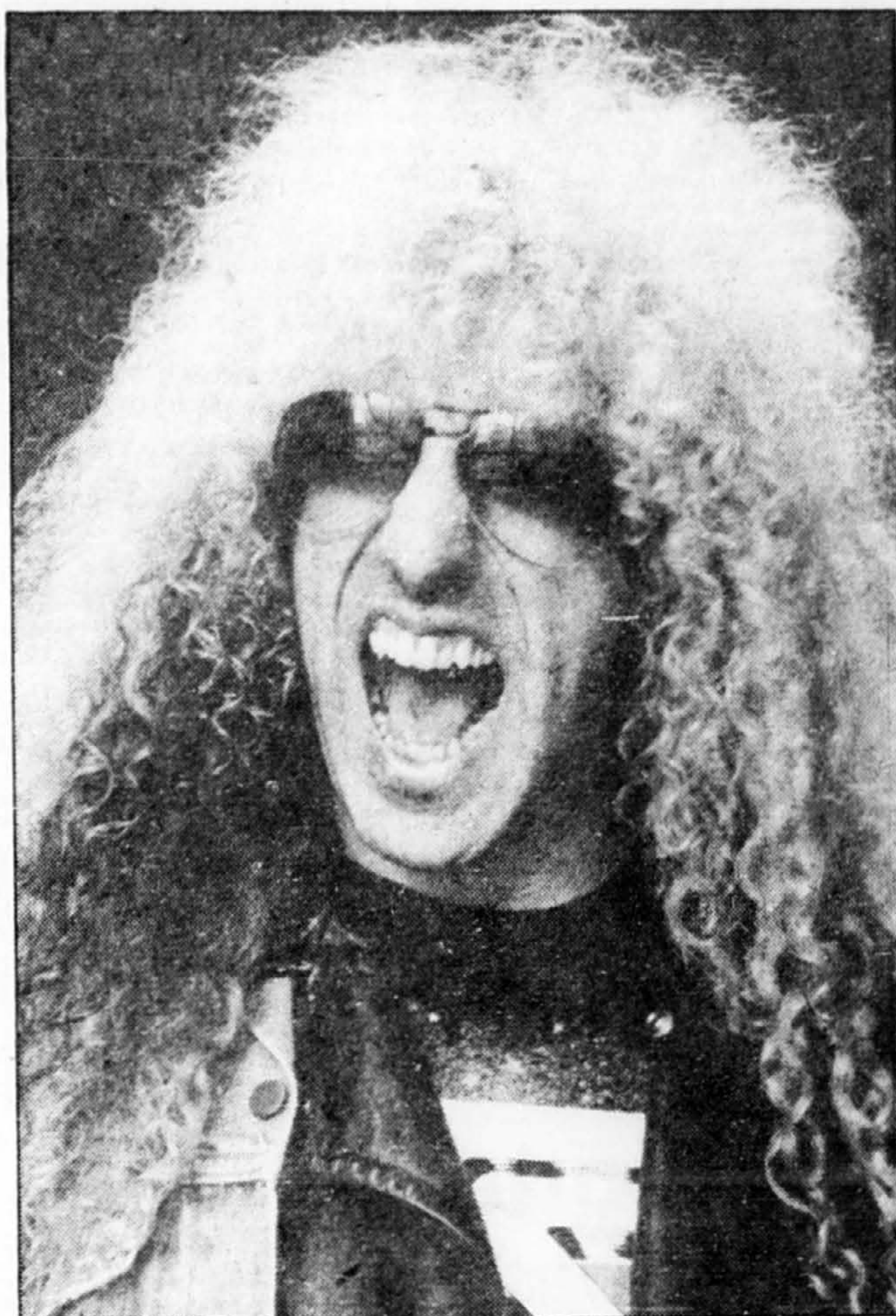
Dee Snider : « Nous n'avons rien à voir avec les histoires de sexe et de drogue... »

Comme tous les groupes du genre, Twisted Sister mise sur l'image, sur le flash, sur le spectaculaire... et Dee Snider ne passe plus inaperçu dans la rue que sur la scène.