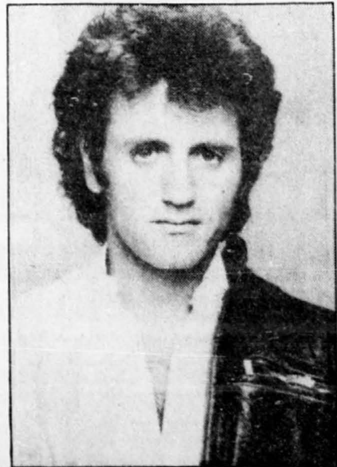
Frank Stallone a participé à la série des Rocky , avec son frère Sylvester, en interprétant une des chansons thème.

Les cheveux bouclés, copie conforme de son