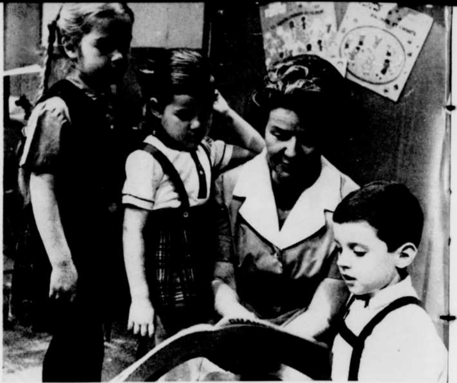
A quatre, cinq et six ans, c'est merveilleux d'apprendre, par les livres et le jeu, toutes les choses nouvelles que la vie peut offrir.

NUL n'ignore ce qu'est un fonfon, une fonfonnette. Vous? Vous ne savez donc pas que tous les petits se transforment en fonfons et fonfonnettes, de 10 à 11 heures, tous les samedis matin? C'est l'heure où maman Fon Fon s'adresse à chacun d'entre eux en l'appelant par son prénom, en le tutoyant.