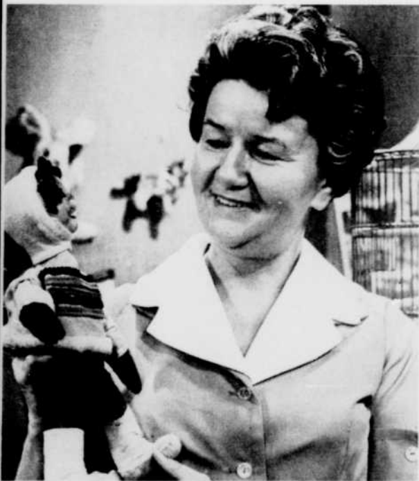
Maman Fon Fon possède une foule de moyens de divertir les petits et de leur apprendre à s'exprimer en faisant appel à leur imagination.