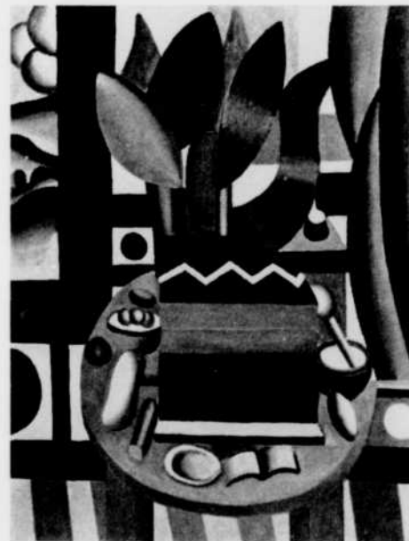
NATURE MORTE (Fernand Léger).

Chacune des demi-heures de L'Art et les hommes mettra l'accent sur un aspect nouveau de la production artistique d'un pays, d'une ville, d'une civilisation ou d'un génie universellement apprécié.