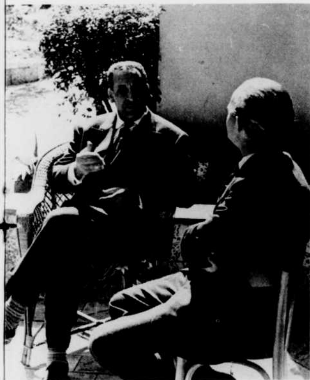
Un moment de l'interview que Ferhat Abbas, chef du Gouvernement provisoire de la République algérienne, a accordée à Gérard Pelletier pour l'émission Premier plan .

Ces trois émissions de la série Premier plan seront réalisées par Claude Sylvestre.