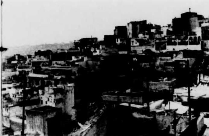
Vue d'un quartier d'Alger.