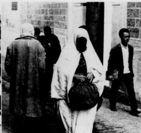
Dans les rues, misère et pauvreté.