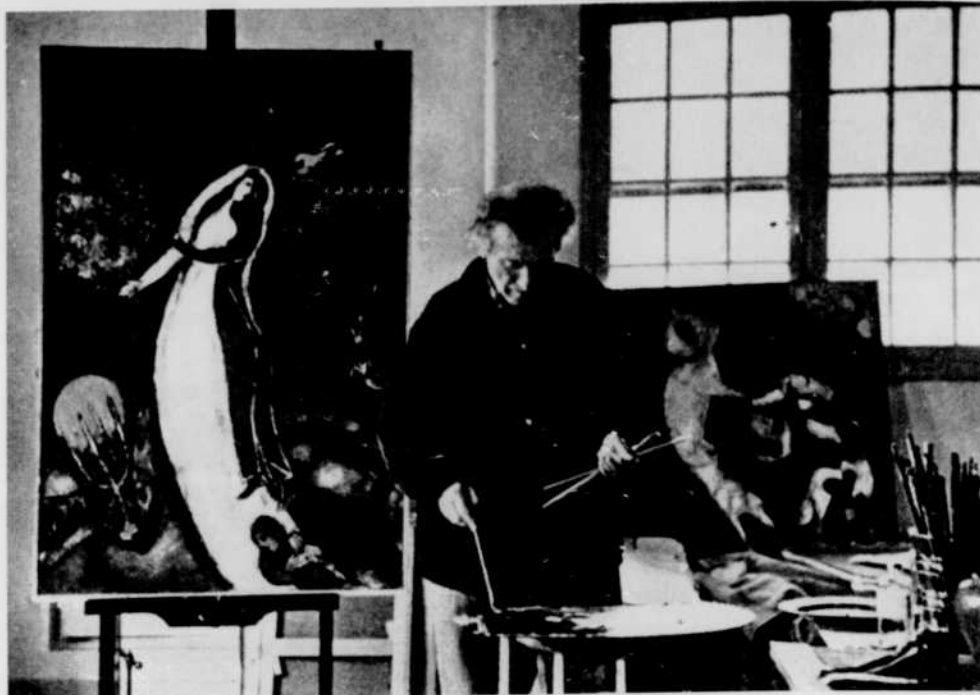
Marc Chagall dans son atelier, à Venise.

Le premier film à l'affiche s'intitule Guerriers dans l'ombre ; il s'agit d'une réalisation du cinéaste anglais Charles Crichton. En vedette : Simone Signoret, Robert Beatty, Jack Warner et Paul Dupuis. Le film raconte une page de la longue et dramatique histoire de la résistance belge. Un réseau de résistance, formé de cinq membres dont un prêtre, s'organise à Londres. Après une période d'entraînement, l'équipe est prête à passer à l'action. Et, pour commencer, ses membres sont chargés de délivrer leur chef capturé par la Gestapo.