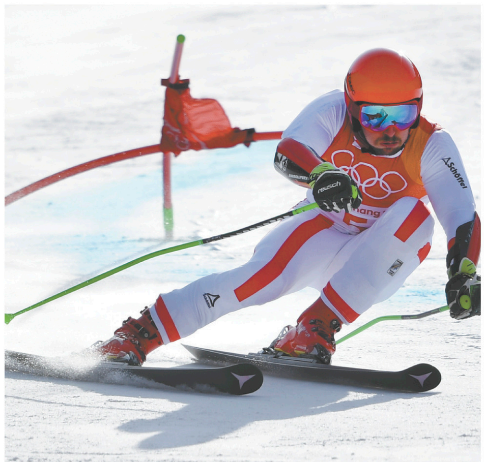
Après la médaille d'or au combiné, l'Autrichien Marcel Hirscher a ajouté le titre olympique du slalom géant à son palmarès.