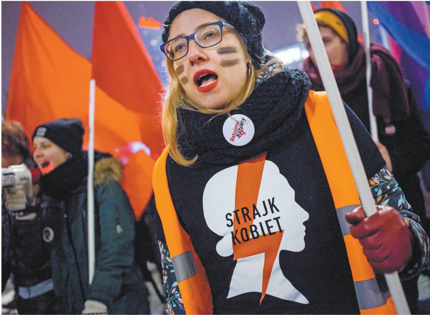
Samedi, des groupes de défense des droits des femmes ont tenu une manifestation pour le droit à l'avortement, à Varsovie.