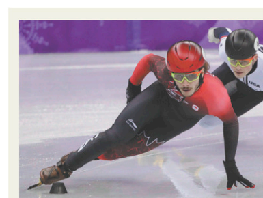
LA PRESSE CANADIENNE