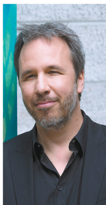
Blade Runner 2049, de Denis Villeneuve, s'est illustré pour les Meilleurs effets visuels et la Meilleure direction photo.

Finalement, Guillermo del Toro, candidat à battre pour