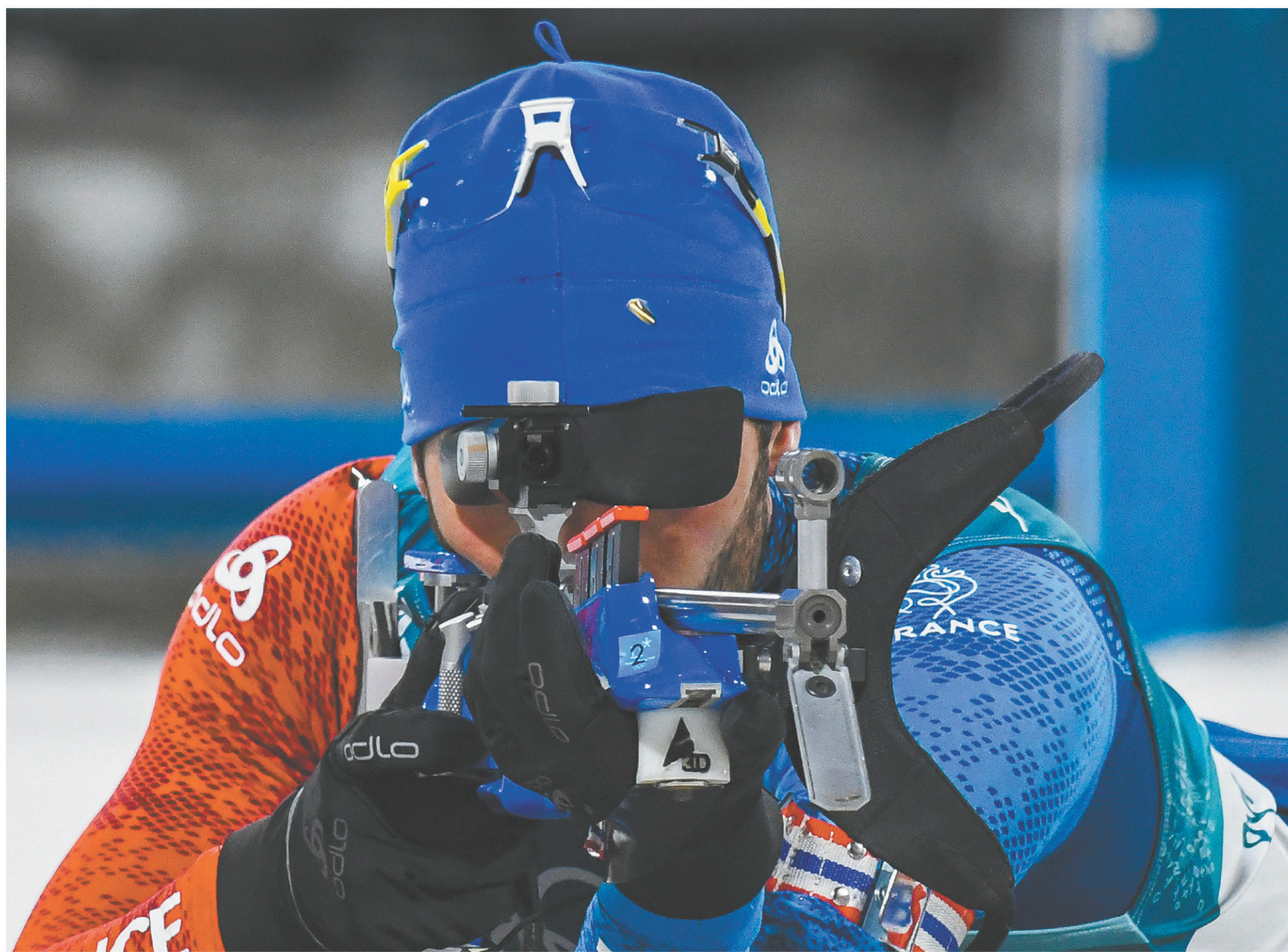
La quatrième médaille d'or olympique de sa carrière acquise au 15 km en départ groupé fait maintenant de Fourcade le Français le plus titré des Jeux olympiques d'hiver.