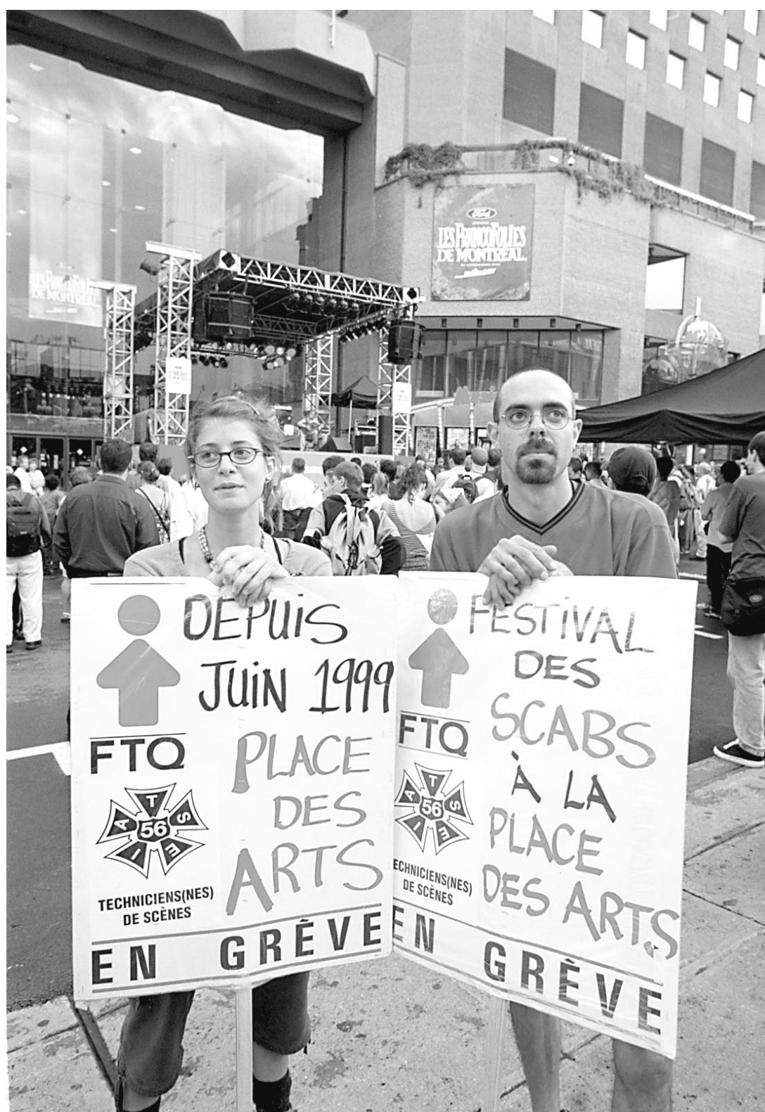
En juillet dernier, les techniciens de la Place des Arts ont manifesté leur mécontentement lors des FrancoFolies.

Il y a la voie de l'arbitrage de différend où les parties s'en remettent à la décision d'un tiers qui décide du contenu de la convention collective; dans le cadre actuel de la loi, une telle éventualité ne peut survenir que si l'employeur et le syndicat en conviennent, à moins évidemment que le législateur impose une telle voie. Finalement, il y a la négociation