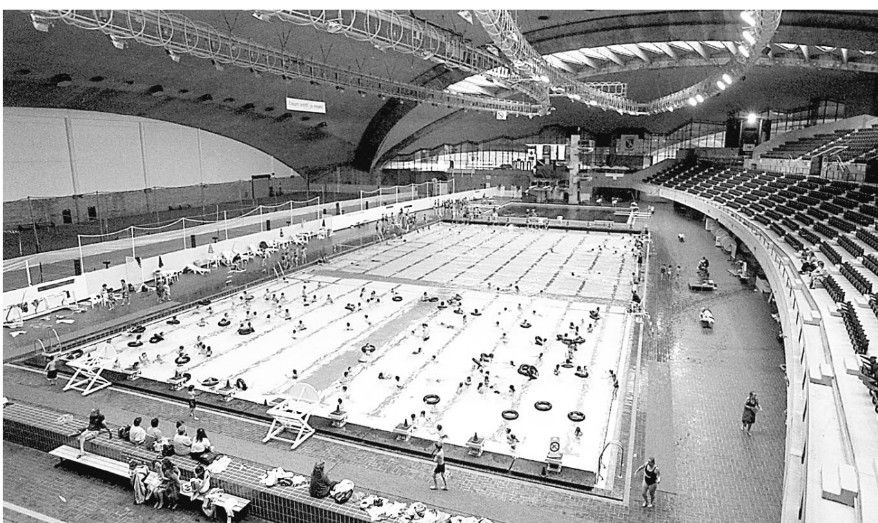
La piscine olympique fera place à des activités plus commerciales.