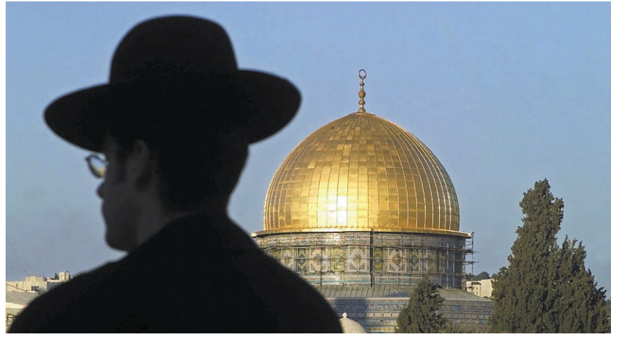
Juif orthodoxe en recueillement hier à Jérusalem, au point le plus chaud du conflit au Proche-Orient.

« Le Temple, c'est un prétexte. Nous sommes prêts à leur donner le Mur, mais ils veulent plus, ils veulent tout », se désole-t-il.