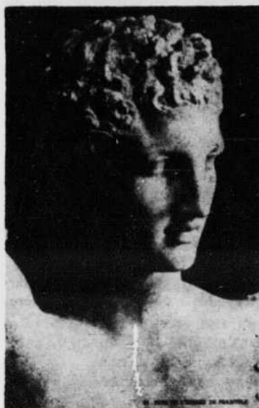
L'Hermès de Praxitèle