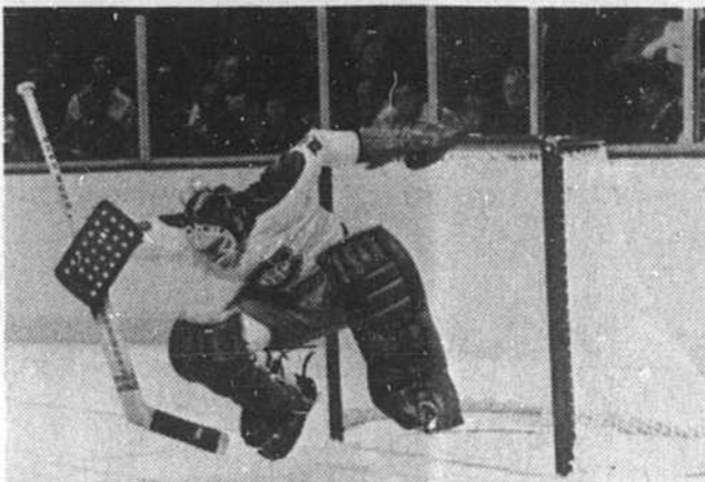
DRYDEN L'ARAIGNEE! Ken Dryden démontre la très grande agilité et il peut faire preuve malgré ses 6 pieds 4 pouces, lors d'un match récent du Canadien au Forum.