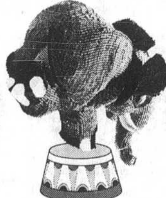
Qui peut en faire autant?

Messieurs, Vous m'assurez qu'un ordinateur Honeywell me coûtera 10 p. cent de moins que tout autre matériel concurrent ayant les mêmes possibilités, ou qu'à valeur égale, il aura un rendement supérieur de 10 p. cent. Très intéressant! Veuillez me contacter pour prendre rendez-vous. Envoyer à: Honeywell Information Systems, 800, boul. Dorchester ouest, Montréal 113, Qué.