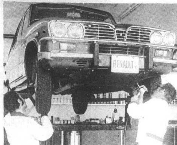
On aperçoit deux spécialistes de l'usine de montage SOMA, à Saint-Bruno, qui injectent le produit "tectyl" antirouille à une nouvelle Renault 16.