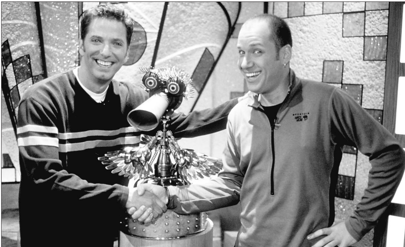
L'animateur Patrice L'Écuyer était fier de remettre le trophée « oiseau » à Martin Matte.

Au panthéon de la menterie, il rejoint l'imitateur Pierre Verville, Claude McKenzie de Kashtin et le