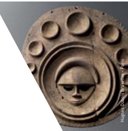
Hughes Dubois Bruxelles - Paris

Les horaires et les activités sont disponibles au www.mcq.org/agenda Abonnez-vous à l'Info-Musée au www.mcq.org/infolettre