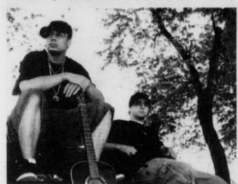
REMIS - L'Assemblée devait offrir une prestation à l'école secondaire Charles-Gravel mardi mais le spectacle a été remis à 2007.