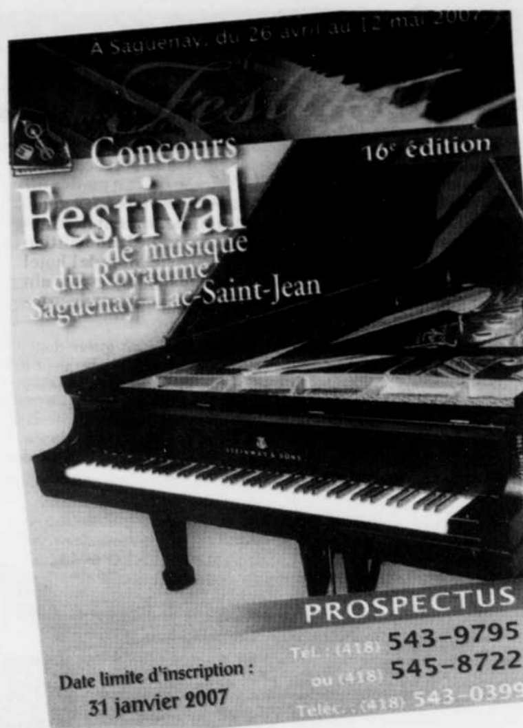
DÉLUGE - Le prospectus de la 16e édition met en vedette ce Steinway sauvé des eaux du Déluge.