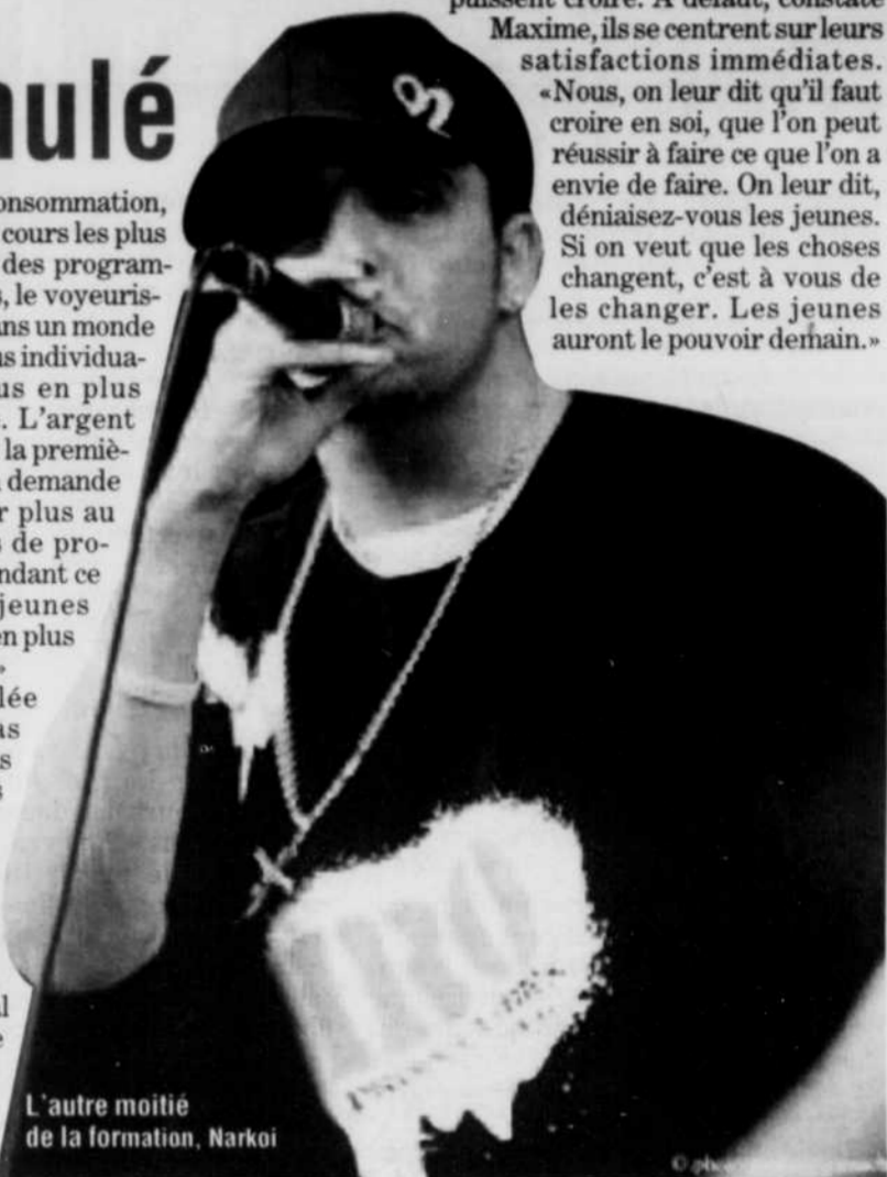
L'autre moitié de la formation, Narkoi

L'Assemblée ne doute pas que les moins de vingt ans soient toujours idéalistes, mais tellement bombardés de stimuli que leur idéal s'émousse faute de phare, de quelqu'un en qui ils