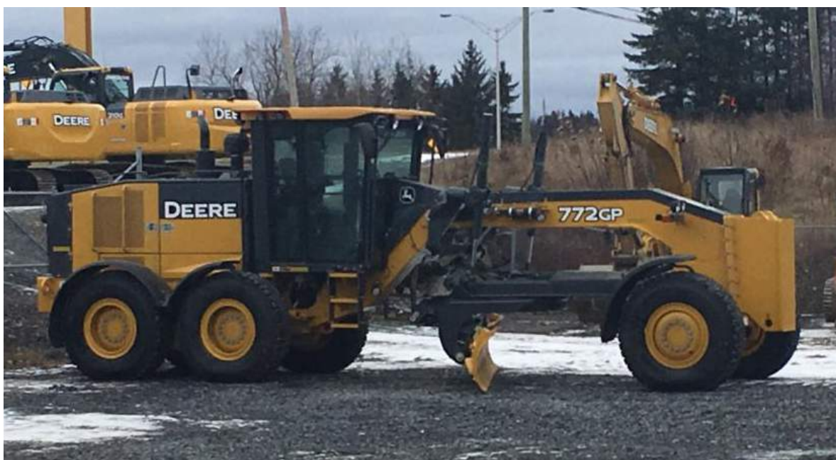
À gauche : Nouvelle niveleuse John Deere acquise par la Municipalité qui entrera en service au cours des prochaines semaines sur notre territoire