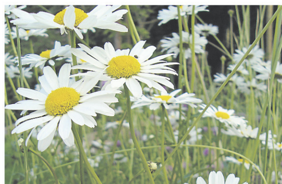
La marguerite blanche, l'une des mauvaises herbes les plus connues en Amérique.

conditions urbaines où j'observe souvent ses tiges velues sortir d'une fissure dans le béton pour former de magnifiques groupes de fleurs d'un orange éclatant. Les premières observations au Québec de l'épervière orangée ( Pilosella aurantiaca ) datent de 1862. Elle était alors utilisée comme plante ornementale, mais a échappé à la culture et se retrouve maintenant un peu partout au Canada et aux États-Unis.