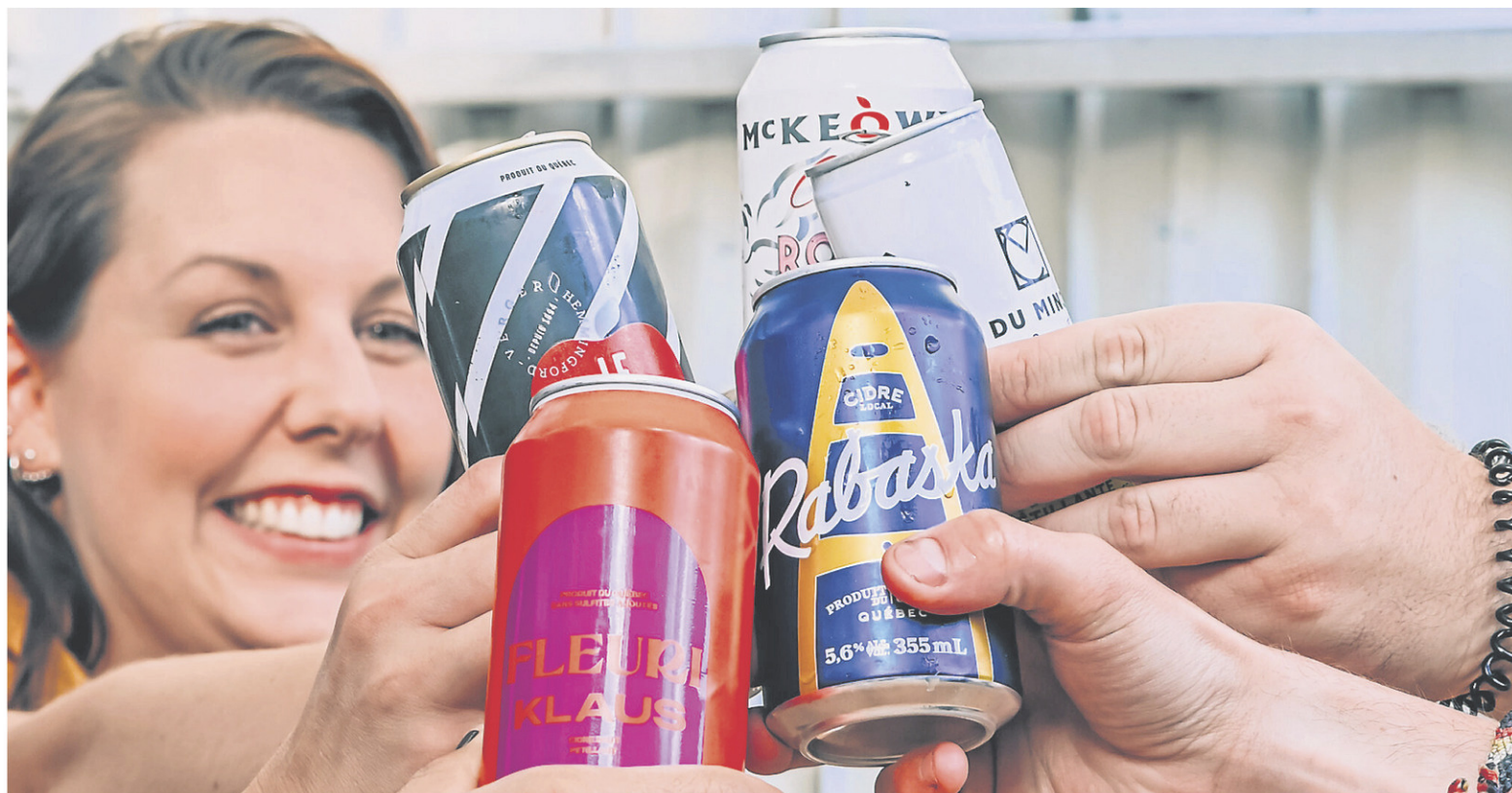
De nos jours, le cidre en canette n'a rien à envier au cidre embouteillé.

Quittons un peu le format de la canette pour nous diriger vers la bouteille en aluminium. Ce cidre rosé est non filtré et présente peu de sucre résiduel. Il présente de légères notes aromatiques de fruits rouges, mais se distingue par son côté rafraîchissant et sec.