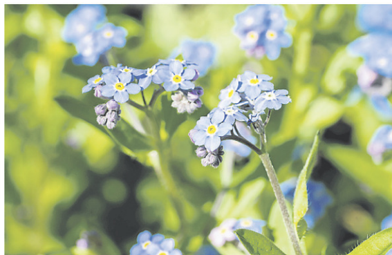
Le myosotis, une plante délicate et de petite taille qu'on retrouve souvent à l'orée des bois.

Bien que ces plantes puissent se répandre, je me suis assuré aussi qu'il n'y a pas de plantes