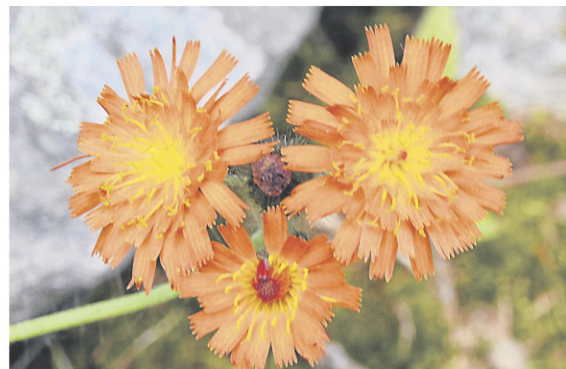
L'épervière orangée s'adapte bien à un sol rocailleux et pauvre.

Formée d'une touffe de feuilles poilues, cette petite vivace fait partie de la famille des astéracées comme l'aster. Elle est originaire d'Europe et d'Asie où on la retrouve dans les montagnes. Elle s'adapte bien à un sol rocailleux et pauvre. Elle est donc tout à fait chez elle dans nos