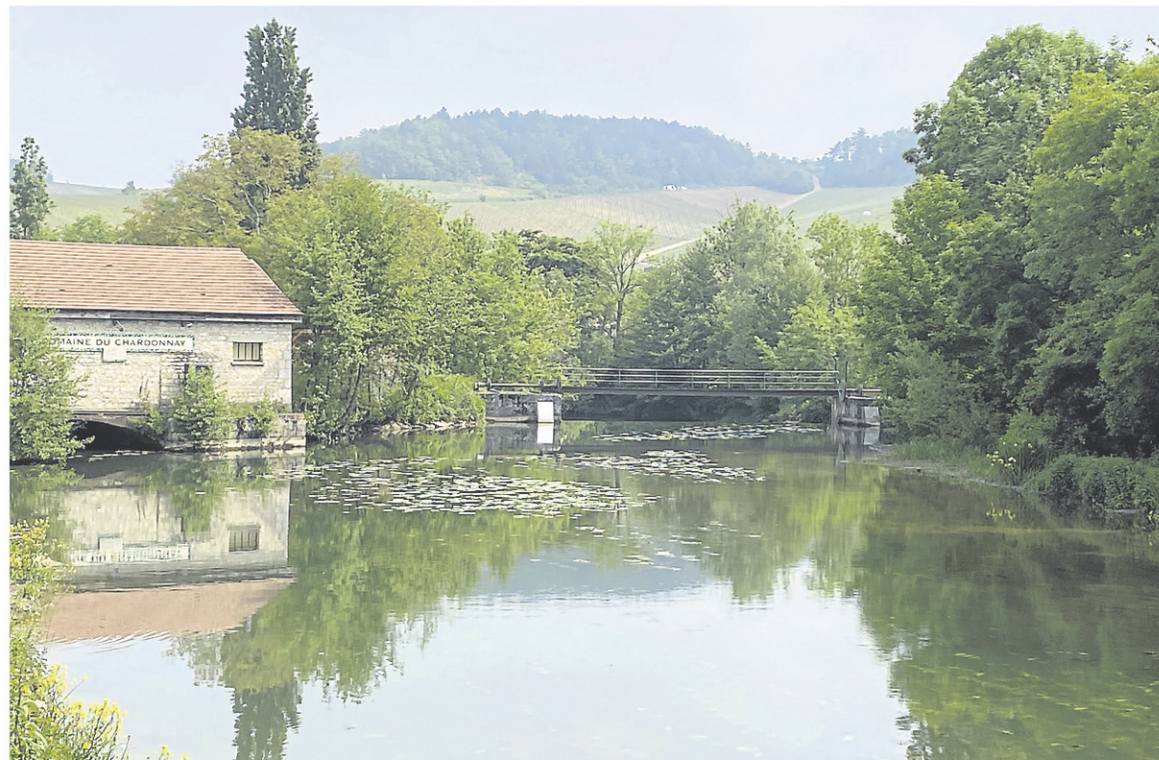
La colline des Grands Crus vue du village de Chablis sur les rives du Serein.