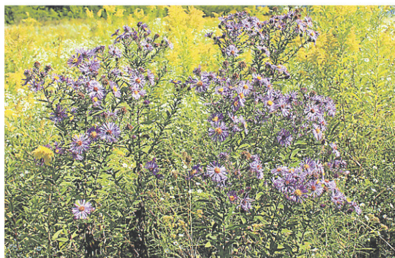
L'aster et la verge d'or.

envahissantes nuisibles dans le lot. Je ne voudrais surtout pas vous encourager à préserver des végétaux qui ont un impact néfaste sur l'environnement, l'agriculture ou la santé humaine.