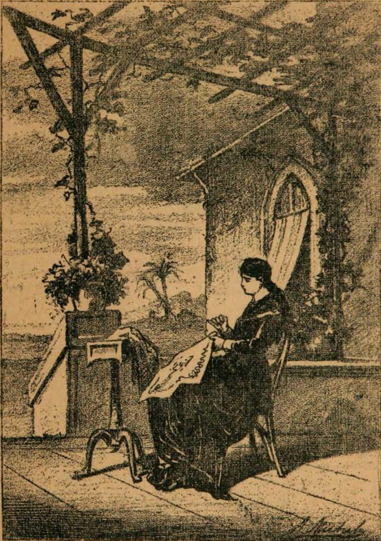
LA FIANCÉE DE M. D'ESTIMAUVILLE.

Il ne se découragea pas et malgré les trahisons des peuplades indigènes, malgré l'insuffisance des secours venant d'Europe, il sut conserver pendant trois ans ce