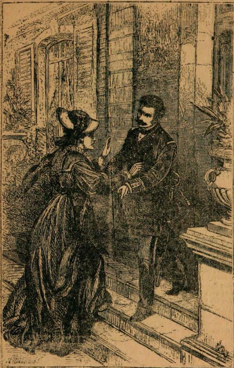
Le capitaine avait été installé dans la salle d'entrée. ( Page 40 )

— Que signifie ceci ? dit-il après l'avoir parcourue, tu as pu croire à tant de perfidie de ma part ?