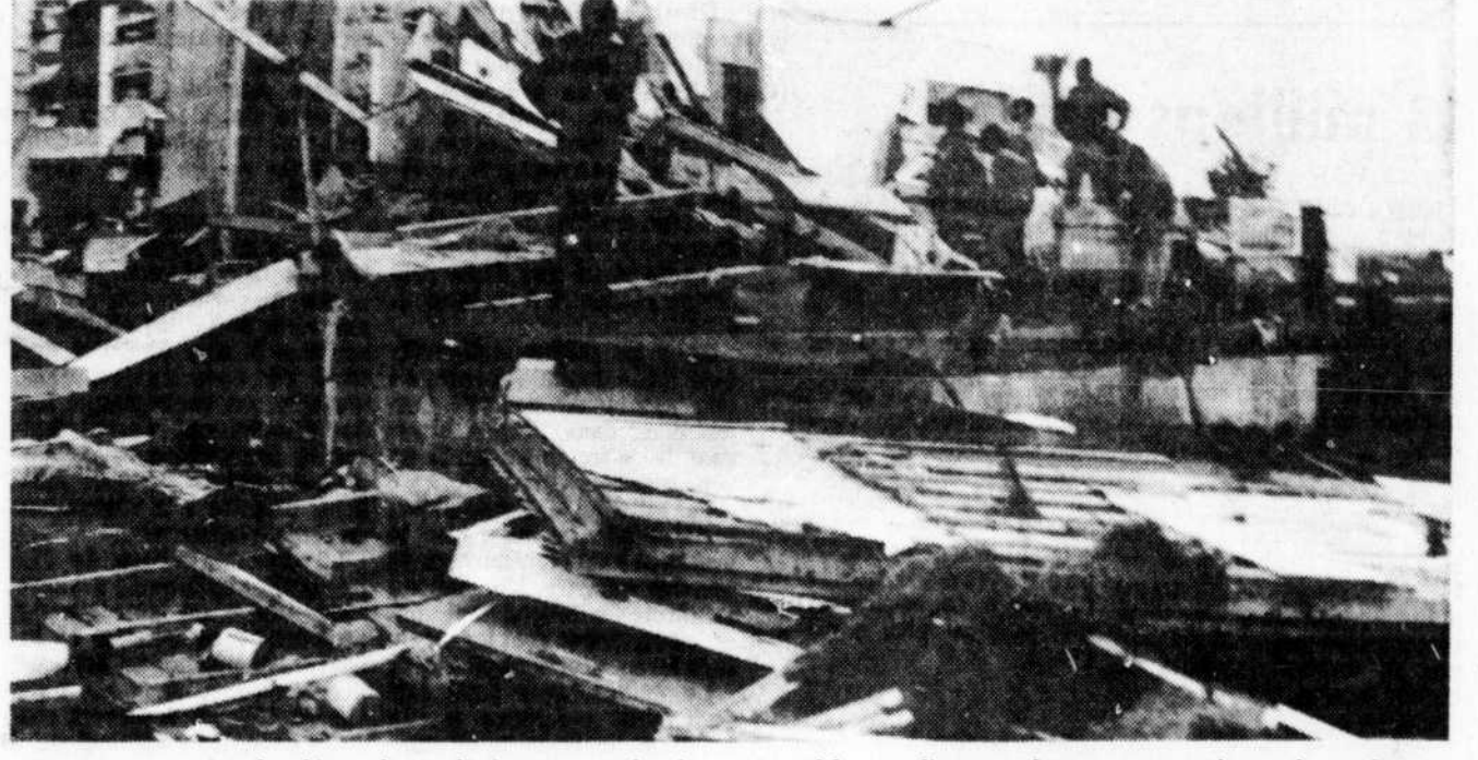
Des montagnes de débris d'où sont sortis vivants par miracle, des dizaines de résidents de St-Bonaventure, lors de la tornade du 24 juillet. Il faut tout rebâtir, recommencer à zéro ou presque, semble se dire cet homme monté sur les ruines d'une maison encore coquette quelques minutes plus tôt.