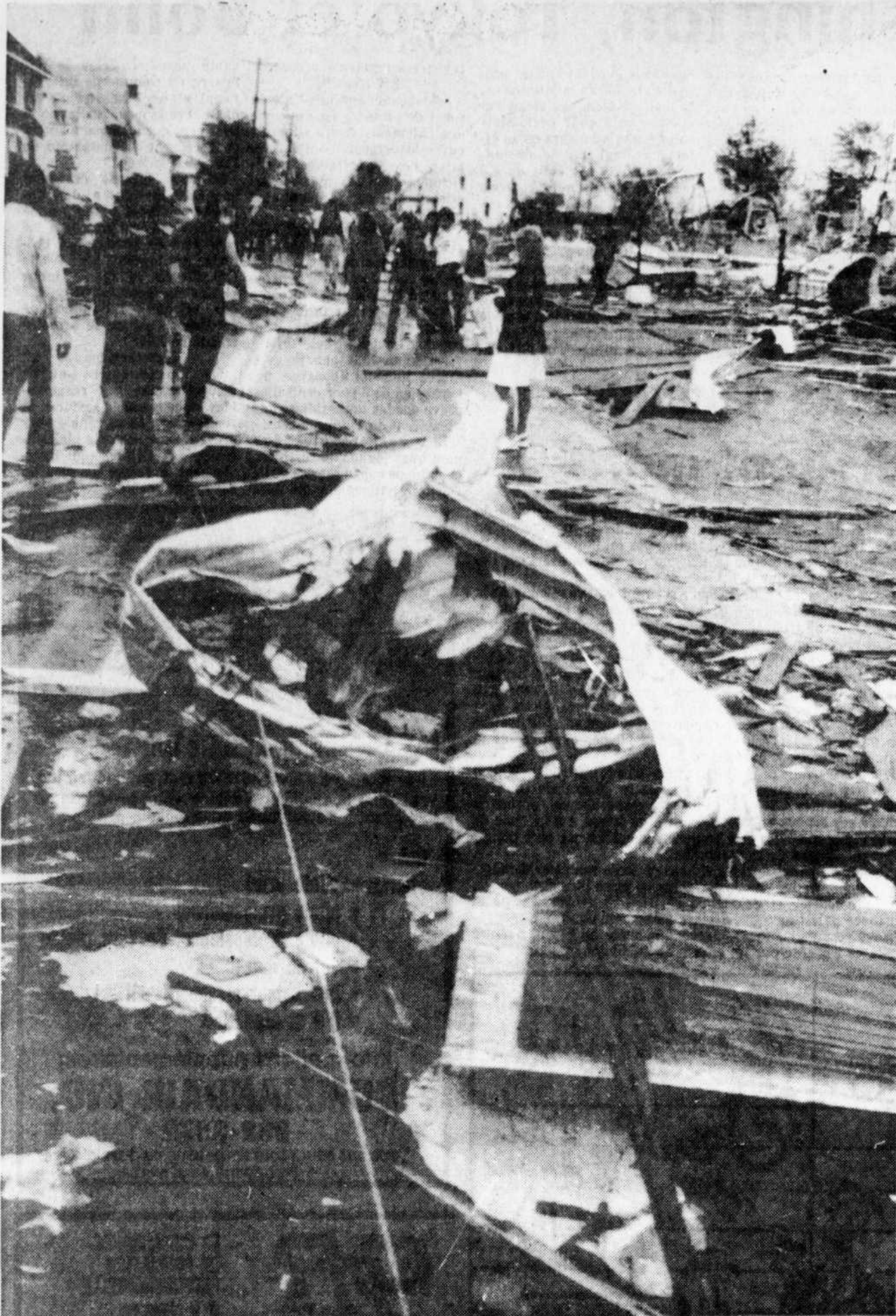
St-Bonaventure, la rue Principale, moins d'une heure après la terrible tornade du 24 juillet, tel que photographié par La Tribune, qui a été le premier organe d'information rendu sur les lieux. (Fils élec-