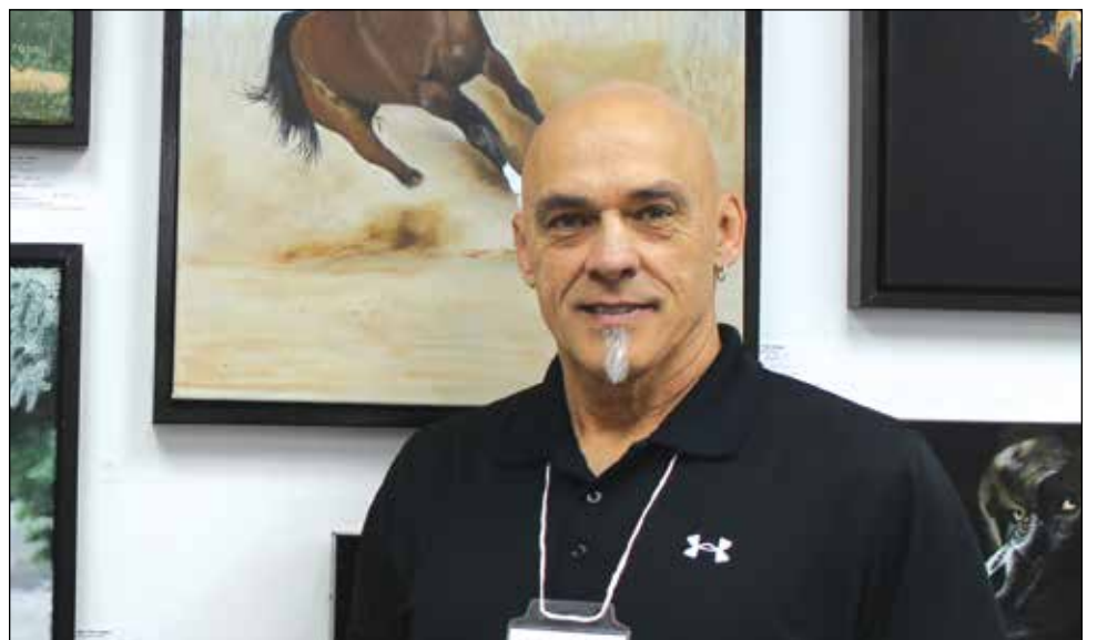
Jean-Yves Crispo (Crispo) est peintre animalier et pratique son art depuis 25 ans. Ses œuvres sont exposées au Canada et en Chine.