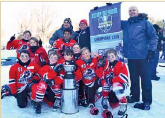
Le 26 janvier, à Laval, c'est sous des conditions météorologiques parfaites que les Gouverneurs Atome B2 ont remporté la Coupe Best Buy.

(JB) Le 26 janvier, à Laval, c'est sous des conditions météorologiques parfaites que les Gouverneurs Atome B2 ont remporté la Coupe Best Buy.