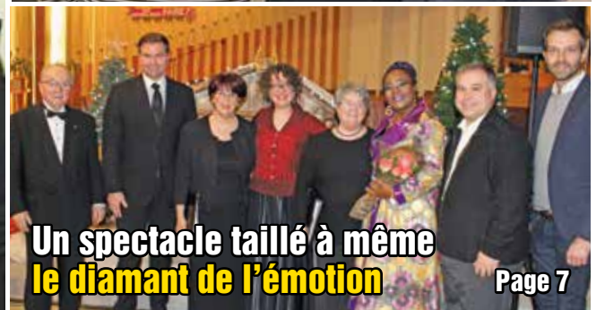
Un spectacle taillé à même le diamant de l'émotion