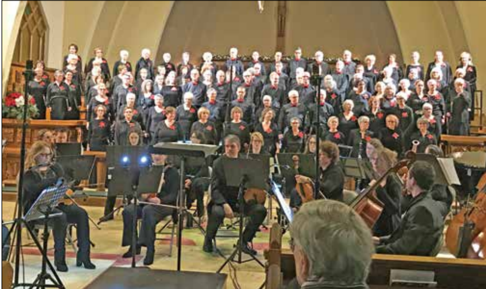
Le Chœur du Vallon a présenté son concert de Noël à l'église Saint-Thomas d'Aquin.

Les pièces interprétées ont célébré la Nativité au fil du temps avec des œuvres de compositeurs tels Pergolèse, Bach, Berlioz et des contemporains comme Trenet, Rutter et Schram. ■