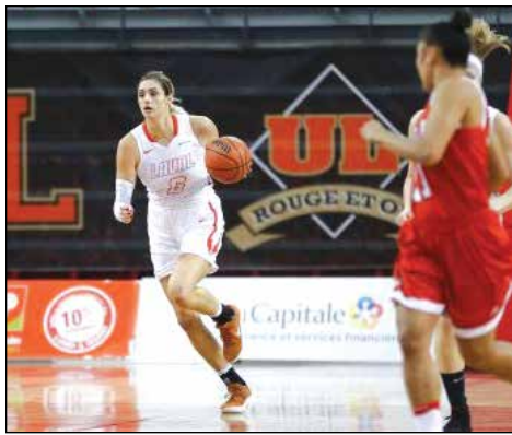
Pour une troisième année de suite, les joueuses du Rouge et Or termineront la saison régulière du RSEQ en tête du classement.

(JB) Pour une troisième année de suite, les joueuses du Rouge et Or termineront la saison régulière du RSEQ en tête du classement, grâce à une victoire sans équivoque de 83-38 sur les Martlets de McGill le 2 février dernier à l'amphithéâtre Desjardins-UL du PEPS.