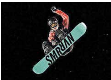
Une étudiante-athlète du Cégep de Sainte-Foy récipiendaire d'une bourse Alcoa Canada.

(JB) Marguerite Sweeney, une étudiante-athlète du Cégep de Sainte-Foy, est l'une des neuf boursières du programme de bourses Alcoa Canada remises par la Fondation de l'athlète par excellence du Québec (FAEQ). L'étudiante en sciences humaines s'est vue remettre une bourse de persévérance scolaire d'une valeur de 4 000 $.