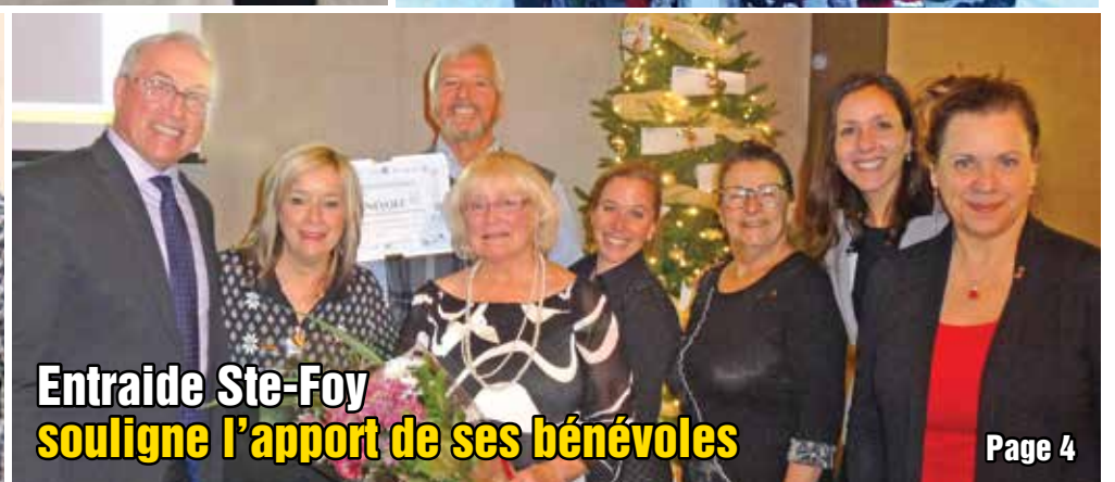
Entraide Ste-Foy souligne l'apport de ses bénévoles