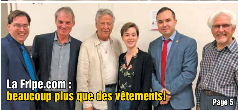
La Fripe.com : beaucoup plus que des vêtements!