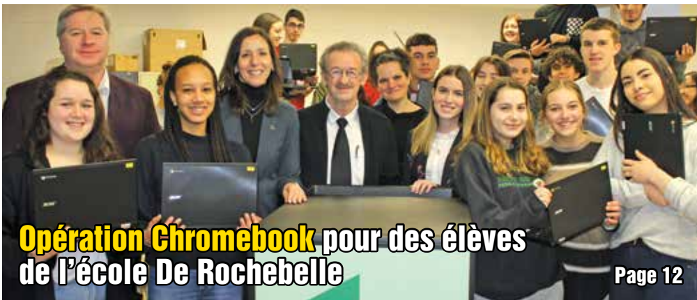
Opération Chromebook pour des élèves de l'école De Rochembelle