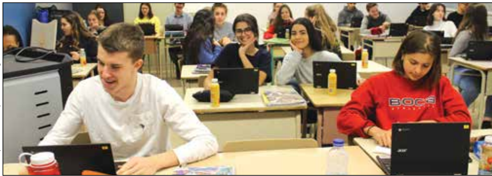
Aussitôt que les ordinateurs Chromebook ont été distribués, les élèves n'ont pas tardé à les utiliser.

train routier. C'est vous dire à quel point la technologie évolue à pas de géant. Un jour, vos petits-enfants regarderont cet appareil et seront étonnés par le peu d'applications qu'il recèle. Les choses vont tellement vite dans ce domaine!» ■