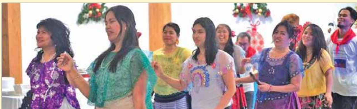
La communauté philippine a eu l'occasion de faire des démonstrations de danses traditionnelles comme la carinosa, d'origine hispanique.

Les familles et leurs amis ont passé une fort belle soirée. Rappelons que NQI a été fondée le 28 janvier 2017. ■