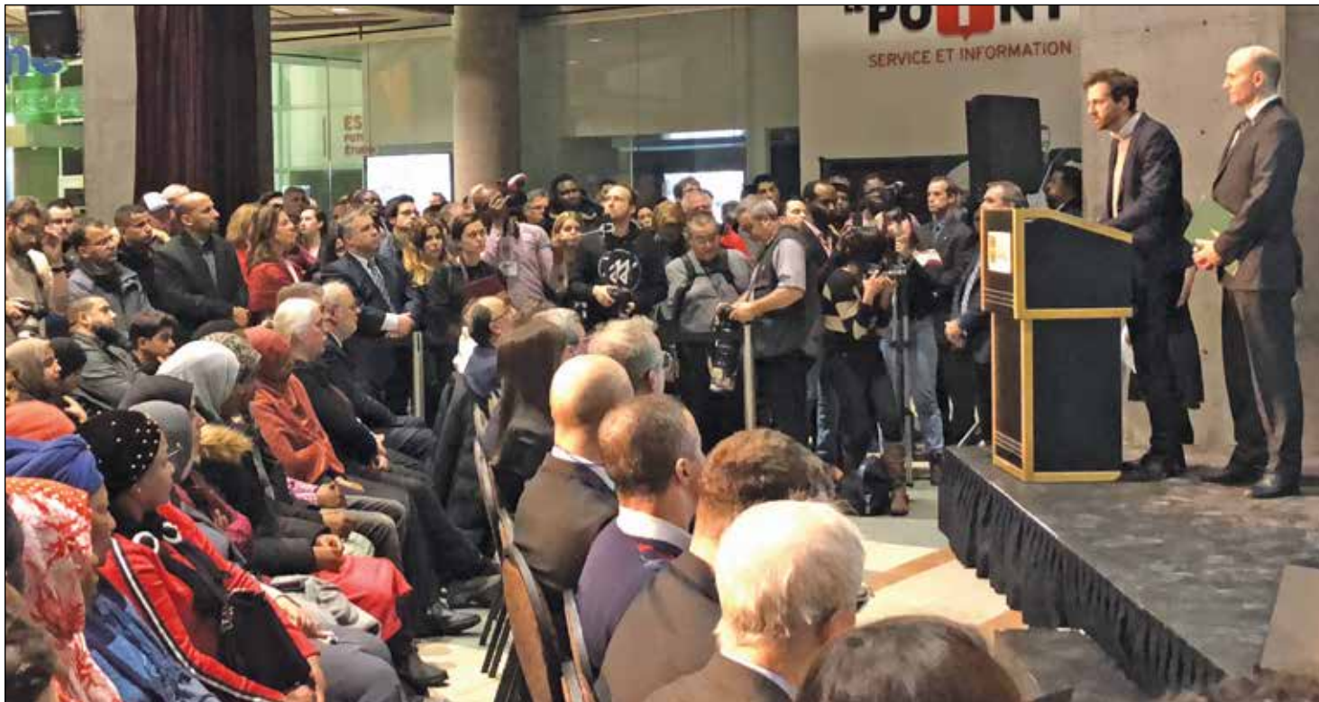
Le député fédéral de Louis-Hébert, Joël Lightbound, était présent lors de la commémoration du 29 janvier dernier, qui s'est tenue au pavillon Desjardins de l'Université Laval.

Il y avait autour de 400 personnes à la commémoration de ce triste événement. Parmi ces dernières, les familles et les amis des victimes et aussi de nombreux dignitaires qui ont pris la parole. Après avoir exprimé sa douleur, M. Lightbound a évoqué le côté lumineux des gens. «... L'amour est plus fort que la haine; que plus dense est l'ombre, nécessairement plus forte est la lumière. Et cette lumière-là, c'est les milliers de mains tendues, les milliers d'hommes et de femmes de bonne volonté qui ont décidé de bâtir des ponts plutôt que d'ériger des murs.» ■