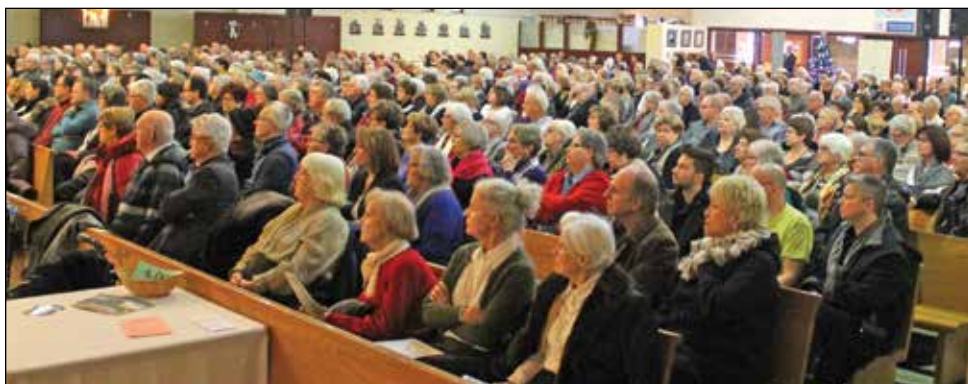
Pour cette occasion, l'église de la paroisse Saint-Benoît Abbé était pleine.