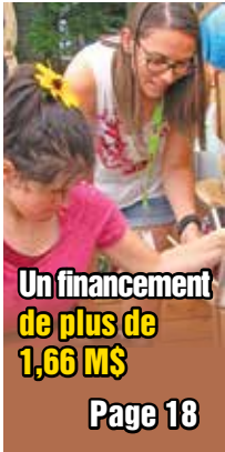
Un financement de plus de 1,66 M$