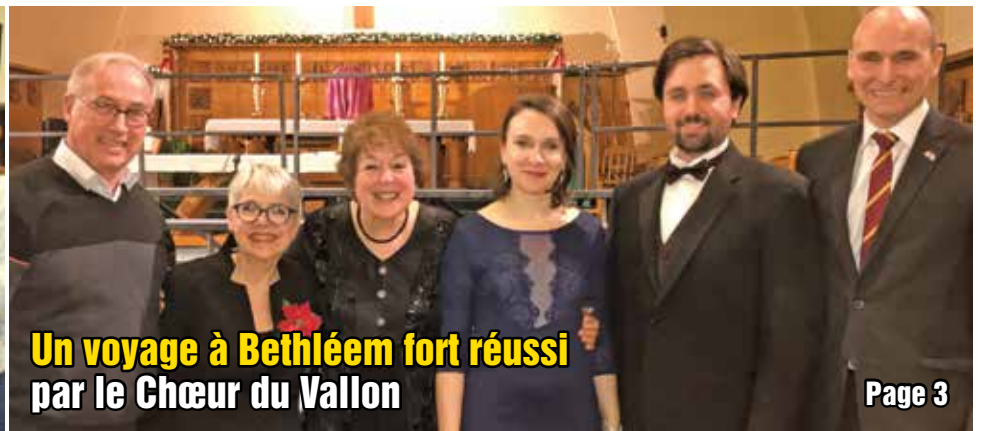
Un voyage à Bethléem fort réussi par le Chœur du Vallon