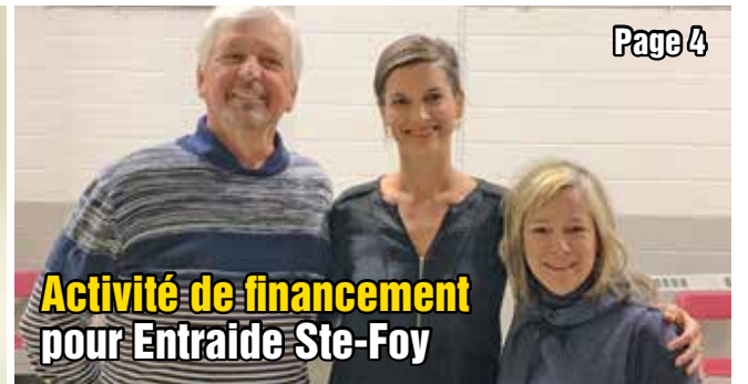
Activité de financement pour Entraide Ste-Foy