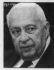
REUTERS Ariel Sharon

D'après un récent sondage d'opinion, une majorité d'Israéliens estime que Sharon devrait démissionner s'il est prouvé qu'il a mal agi.