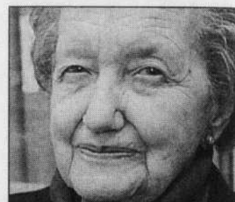
Brenda Milner

notre époque. Sa présentation détaillée du dysfonctionnement de la mémoire à la suite de lésions de l'hippocampe a servi d'assise à la compréhension moderne de la mémoire et des divisions des mécanismes de stockage de la mémoire», a soutenu hier par voie de communiqué le docteur Eric Kandel, professeur au Centre de neurobiologie de l'université Columbia et lauréat du prix Nobel de médecine en 2000.