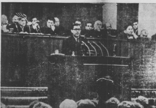
Il ministro degli esteri russo, Andrei Gromiko, nel discorso di chiusura della sessione parlamentare sovietica, a Mosca, ha dichiarato che la disputa di Berlino potrebbe essere causa di una terza guerra mondiale che inevitabilmente si estenderebbe nel continente

La convertibilità della lira impugna a continuare e sviluppare la linea finanziaria seguita nell'ultimo decennio, in virtù della quale si è data una notevole forza espansiva al nostro