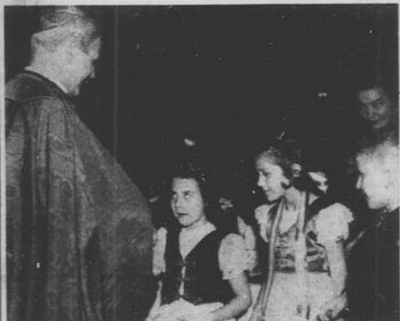
Sua eminenza il cardinale Paul Emile Lezer si intrattiene coi suoi piccoli amici neo-canadesi nel corso della "festa dell'amicizia" offerta dal "Service d'Accueil aux Voyageurs", presso la caserma dei "Fusiliers Mont-Royal", il 27 dicembre scorso.