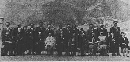
Un gruppo di spose regionali convocate a Merano per l'assegnazione del Premio NECCHI "La Sposa d'Italia 1958".

ROMA (Agt). — Sempre più importanza va assumendo la RAI-TV italiana al fine della diffusione allo interno e all'estero non soltanto del notiziario quotidiano, ma della cultura del paese. Questa funzione è particolarmente apprezzata dai nostri connazionali all'estero che attraverso la RAI-TV possono mantenere, dovunque si trovino, un ininterrotto contatto con la madre patria. Al proposito delle nostre trasmissioni radiofoniche e televisive si è aggiunto ora, nel quadro delle trasmissioni dei corsi di lingua estera, un concorso a premi legato alle lezioni di lingua inglese, francese e tedesca. I premi hanno lo scopo di diffondere sempre meglio la conoscenza di tali lingue in Italia. Fra le trasmissioni di questi ultimi tempi, molto apprezzata dagli ascoltatori è stata quella relativa ad una canzone che è legata alla storia del Risorgimento italiano: la Bella Gigogin. I più vecchi fra gli emigranti italiani ricorderanno con un senso di profonda nostalgia questa bella canzone, in voga fin nei primi anni del secolo; e egualmente ricorderanno che, nei tempi passati, i soldati delle guerre del Risorgimento andavano anche in battaglia cantando la "Bella Gigogin".