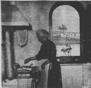
Le cucine delle nuove case coloniali costruite nel piano della Riforma Agraria, sono fornite di ogni comodità.

In fine gli ambienti universitari italiani hanno appreso con soddisfazione la notizia della concessione dei premi al merito ad otto persone per il contributo dato alla fondazione, al completamento e all'attività della "Casa Italiana" presso la Columbia University.