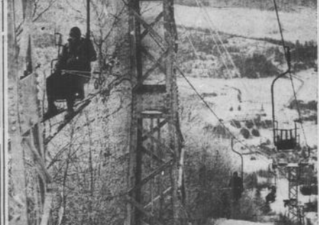
Le seggiovie dei Monti Trablant Lodge, nelle Laurentian Mountains, hanno un gran da fare in questa stagione: numerosissimi sono infatti gli sciatori che se ne servono.

Al 18' della ripresa, un formidabile tiro al volo da fuori area di Grillo