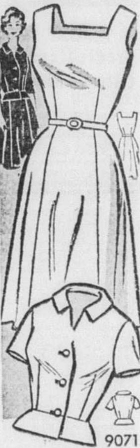
Si le décolleté carré vous avantage, voilà un gentil modèle de robe à jaquette.

Le patron imprimé No 9071 est offert pour les demi-tailles: 14½, 16½, 18½, 20½, 22½, 24½. La grandeur 16½ requiert robe et jaquette, 5¼ verges d'un tissu de 35 pouces de largeur.