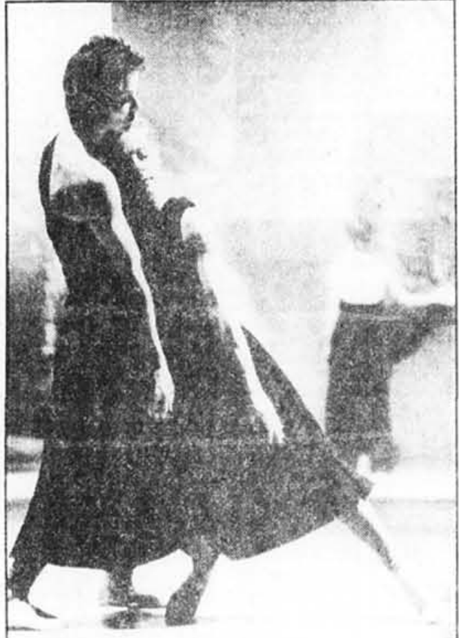
«Silent Partners» de Second Stride

■ Pina Bausch mise à part, Anne Teresa de Keersmaecker est la chorégraphe la plus intéressante en Europe présentement. Je ne me souviens plus qui, parmi les participants au débat du Musée des beaux-arts mercredi soir (débat qui n'en fut pas un, mais plutôt une série d'exposés factuels sur la nouvelle danse internationale), a fait cette affirmation, mais aussitôt ses collègues outre-Atlantique ont hoché la tête en signe d'acquiescement.