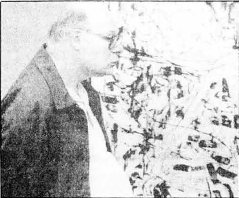
Un spectateur ébahi devant un Riopelle

Si la galerie Maeght-Lelong participe à Art Expo Montréal, c'est, bien sûr, à cause de Jean-Paul Riopelle, un des artistes de la galerie, auquel le Salon rend hommage cette année. La galerie est venue à Montréal avec des œuvres récentes de Riopelle qui