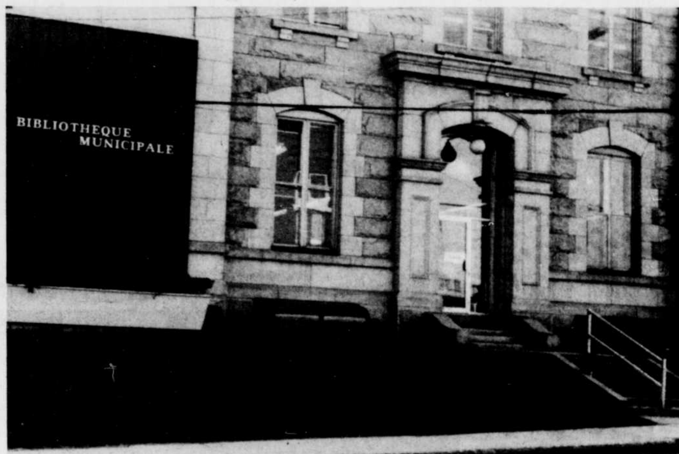
La bibliothèque municipale de Sherbrooke demeure un lieu fréquenté par des personnes ne souffrant pas de difficultés de locomotion...