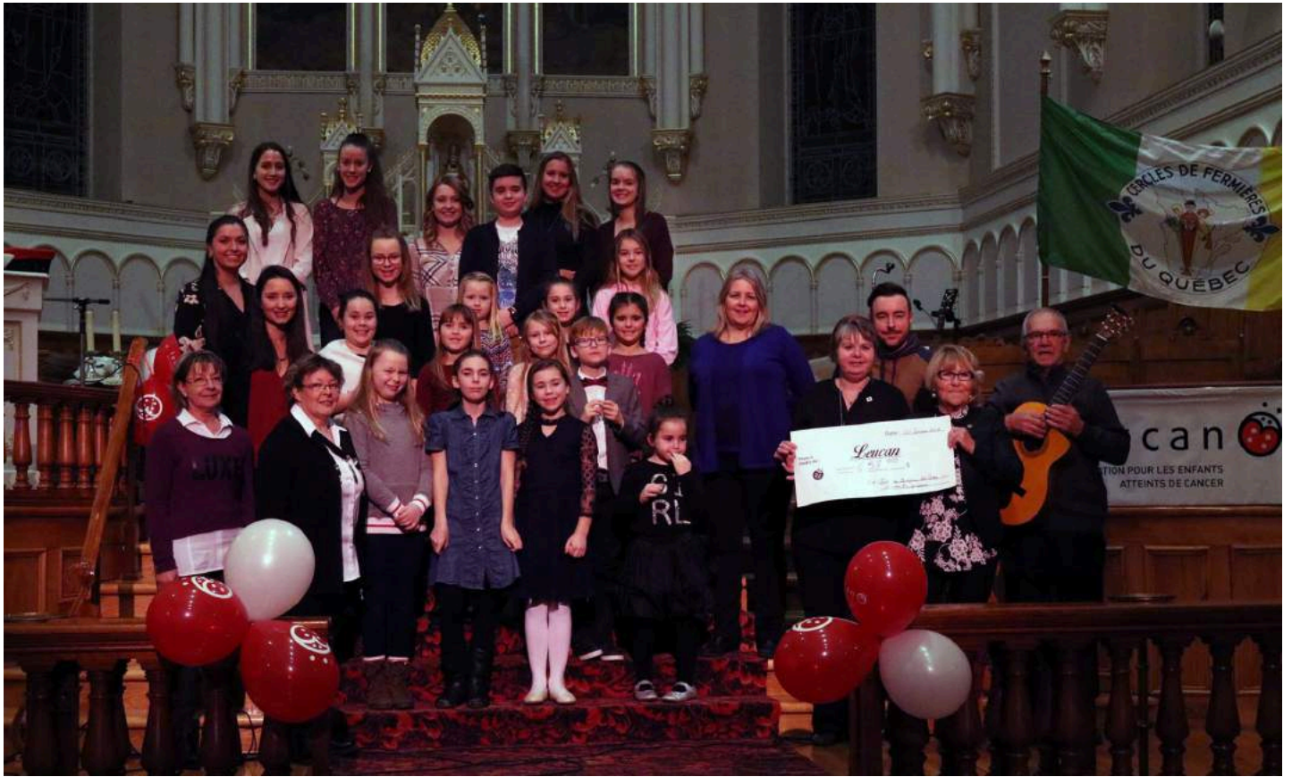
20 février: Merci à tous ceux qui ont collaboré au concert-bénéfice pour LEUCAN, organisé par le Cercle des Fermières, ayant été tenu à l'église de Saint-Victor. L'événement a permis d'amasser un montant de 707$.