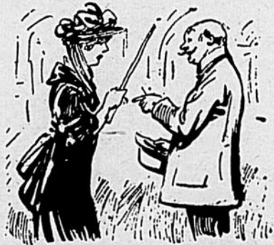
— Madame — Je suis veuve depuis deux ans, monsieur. Monsieur — Madame, je suis veuf depuis trois ans. Unissons nos douleurs.