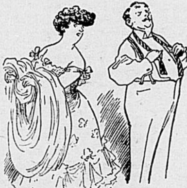
Elle — Où vas-tu ce soir? tu te mets bien beau. Lui — Réponds à ta question et... tu le sauras.