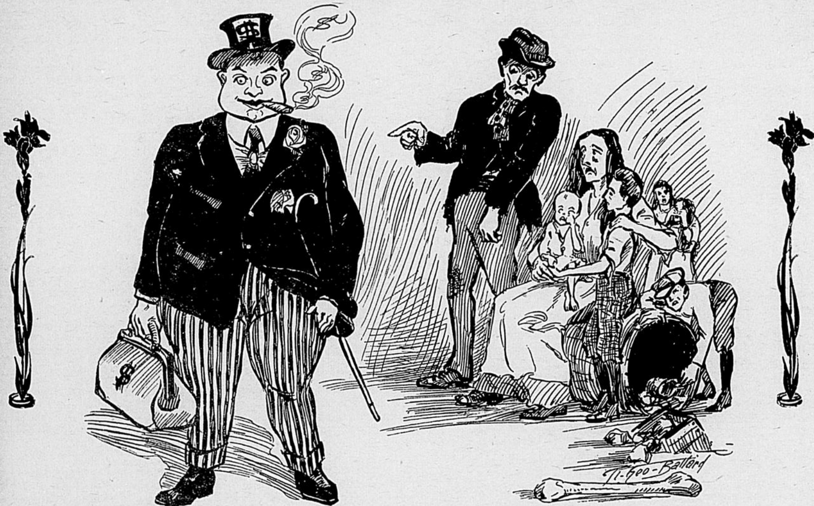
L'OUVRIER — C'est lui qui empoche tout et nous laisse crever de faim.