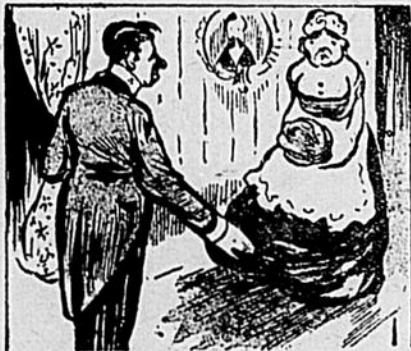
Monsieur — Quel est le cochon qui a sali le plancher comme ça? Marie — Il n'y a que... monsieur qui est venu ici.