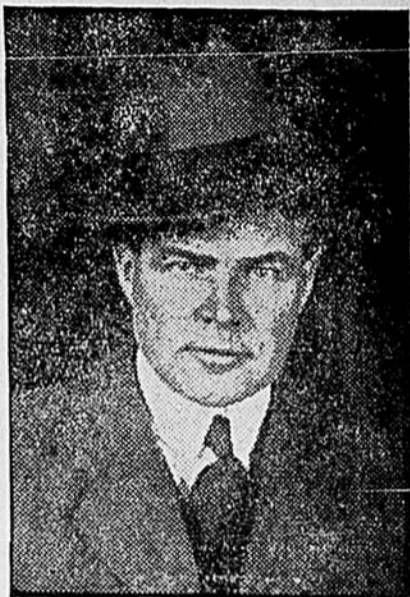
E. W. BEATTY Le nouveau président du C.P.R.

"Mais, demandions-nous à M. Beatty, comment transporter tous ces soldats réformés ? Pensez-vous que la nationalisation du Pacifique Canadien pourra contribuer à la solution de ce grand problème ?