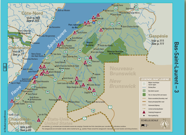
Bas-Saint-Laurent - 3

Le CDCQ publie au mois de février de chaque année le guide du camping au Québec. L'édition 2009 du guide regroupe plus de 855 établissements de camping. Tous les campings ayant obtenu un résultat supérieur à 0 étoile peuvent acheter une fiche descriptive (voir image ci-dessous) En 2009, 532 campings se sont annoncés par fiche descriptive dans le Guide. Parmi eux, 150 ont ajouté une page ou une 1/2 page de publicité.