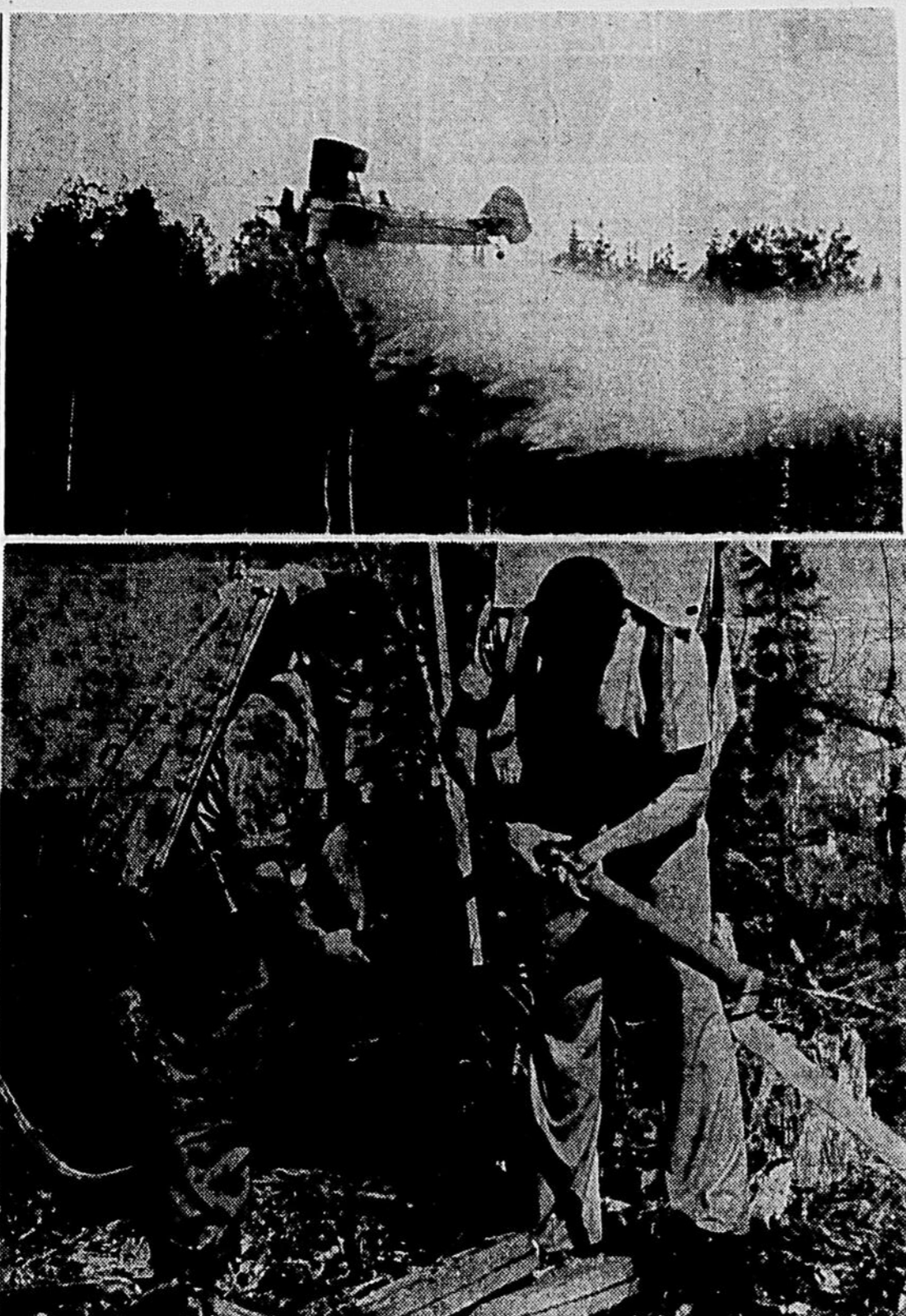
Pour la première fois au Canada, on a fait l'essai, au moyen d'avions "Stearman", d'une solution chimique pour maîtriser les incendies de forêts. Il s'agit du bombardement des arbres à l'aide de borate de calcium sodique qui empêche les flammes de se propager, en attendant l'arrivée de l'équipe de terre qui poursuivra la lutte contre le feu au moyen d'équipement ordinaire: pompes, boyaux, etc.