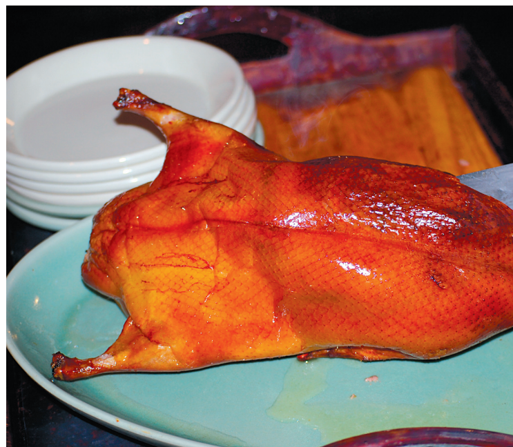
L'un des mets les plus estimés, réservé à l'élite et aux touristes, est le canard laqué dit « de Pékin ».