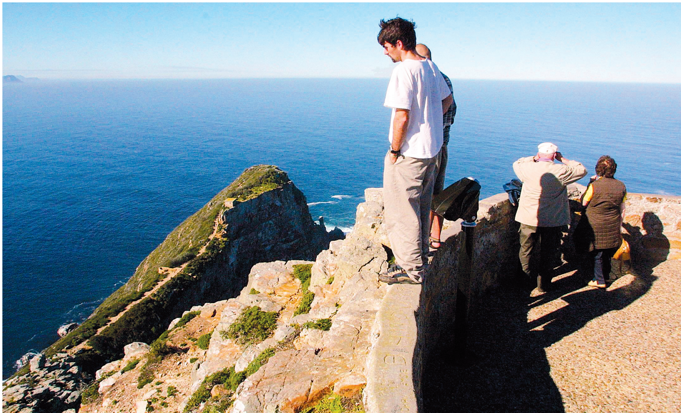
ANNA ZIEMINSKI AGENCE FRANCE-PRESSE

Anguilla entretient soigneusement sa réputation d'endroit de luxe, avec une structure hôtelière propre à décoiffer le porte-monnaie le plus ouvert. Mais il est possible de trouver des solutions de rechange aux palaces proposés. On parcourt l'île à pied, en scooter et à bord de voitures de golf.