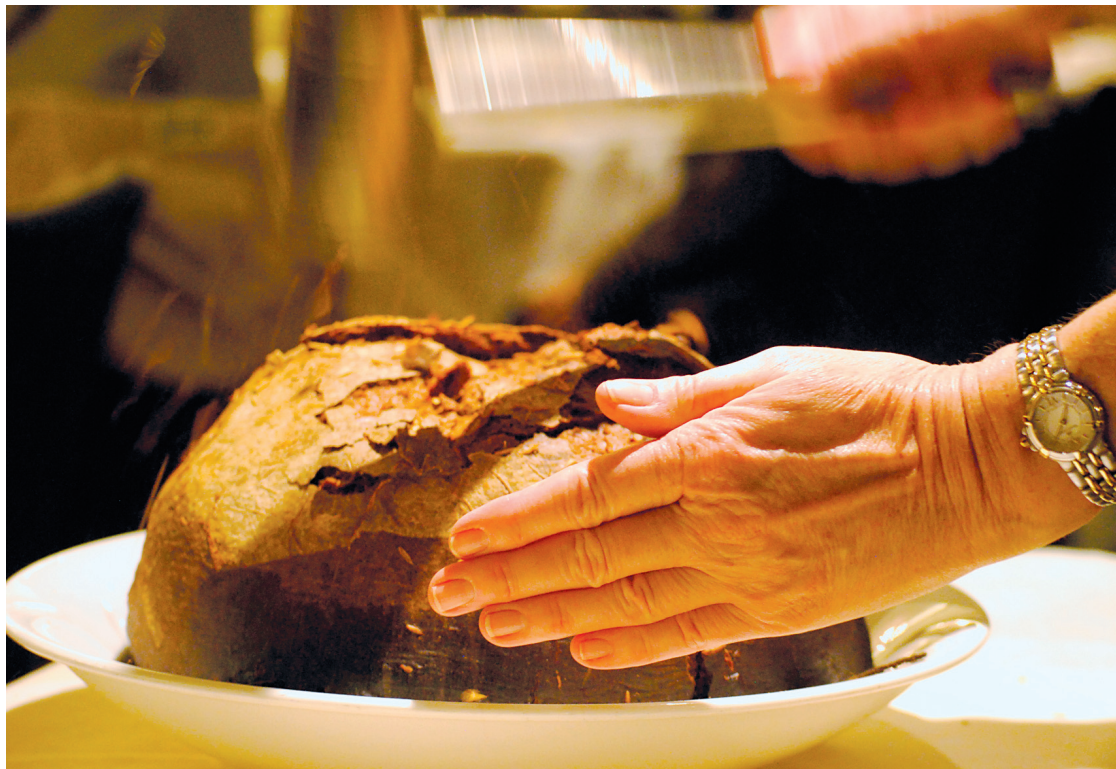
Le poulet en cocotte d'argile, servi avec un cérémonial presque théâtral: à l'aide d'un marteau, on brise la croûte d'argile avant de découper la volaille et d'ajouter une garniture épicée.

Les familles chinoises d'ici et d'ailleurs préparent cette fête du printemps et de la lune pendant des semaines. Pour les Chinois, les repas sont des rassemblements de la plus grande importance, tant à la maison que dans les restaurants, qui sont pris d'assaut à cette époque, les réservations ayant parfois été faites plusieurs mois plus tôt. Ces repas peuvent souvent représenter