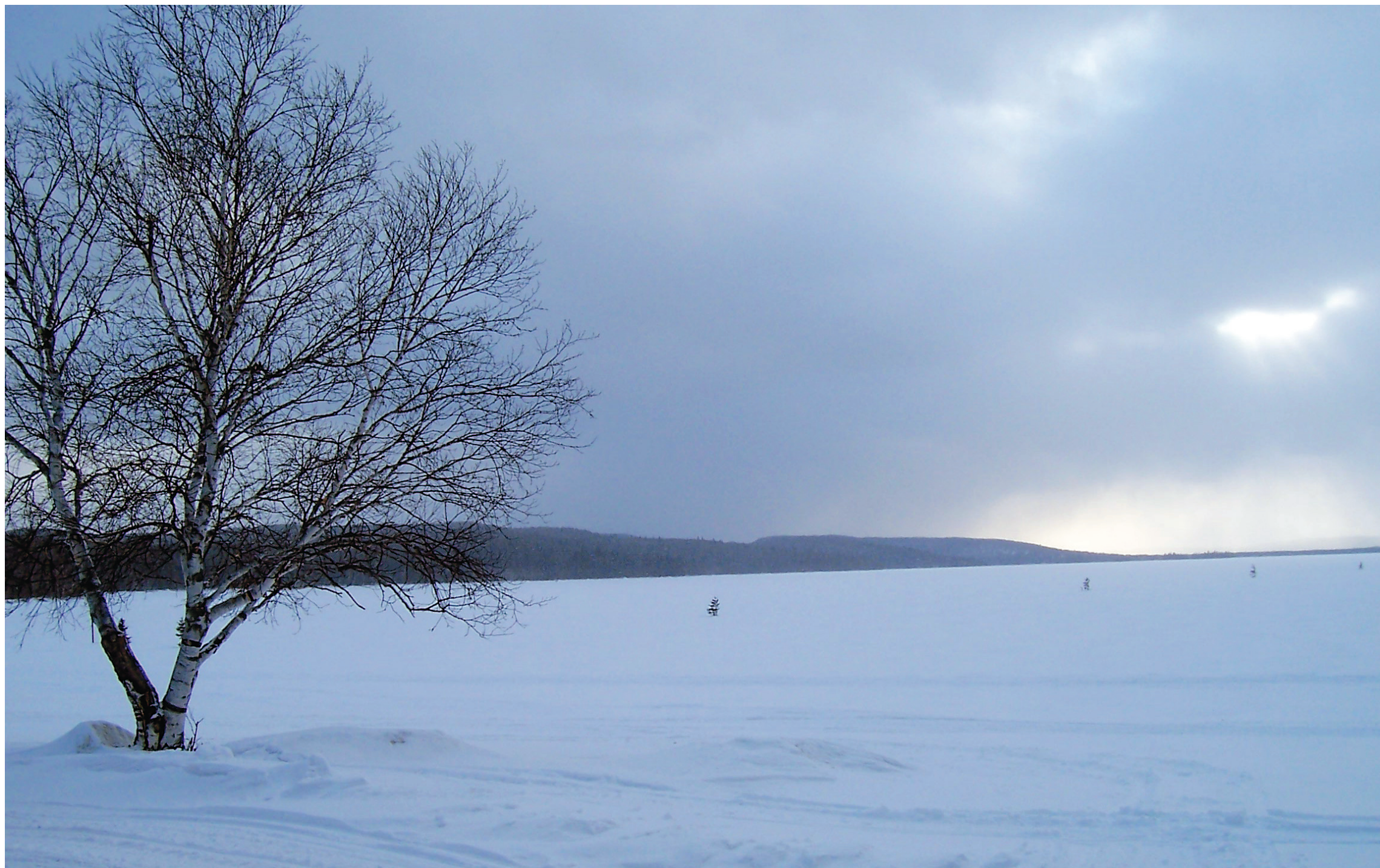
Un paysage hivernal typique de la région de l'Outaouais.