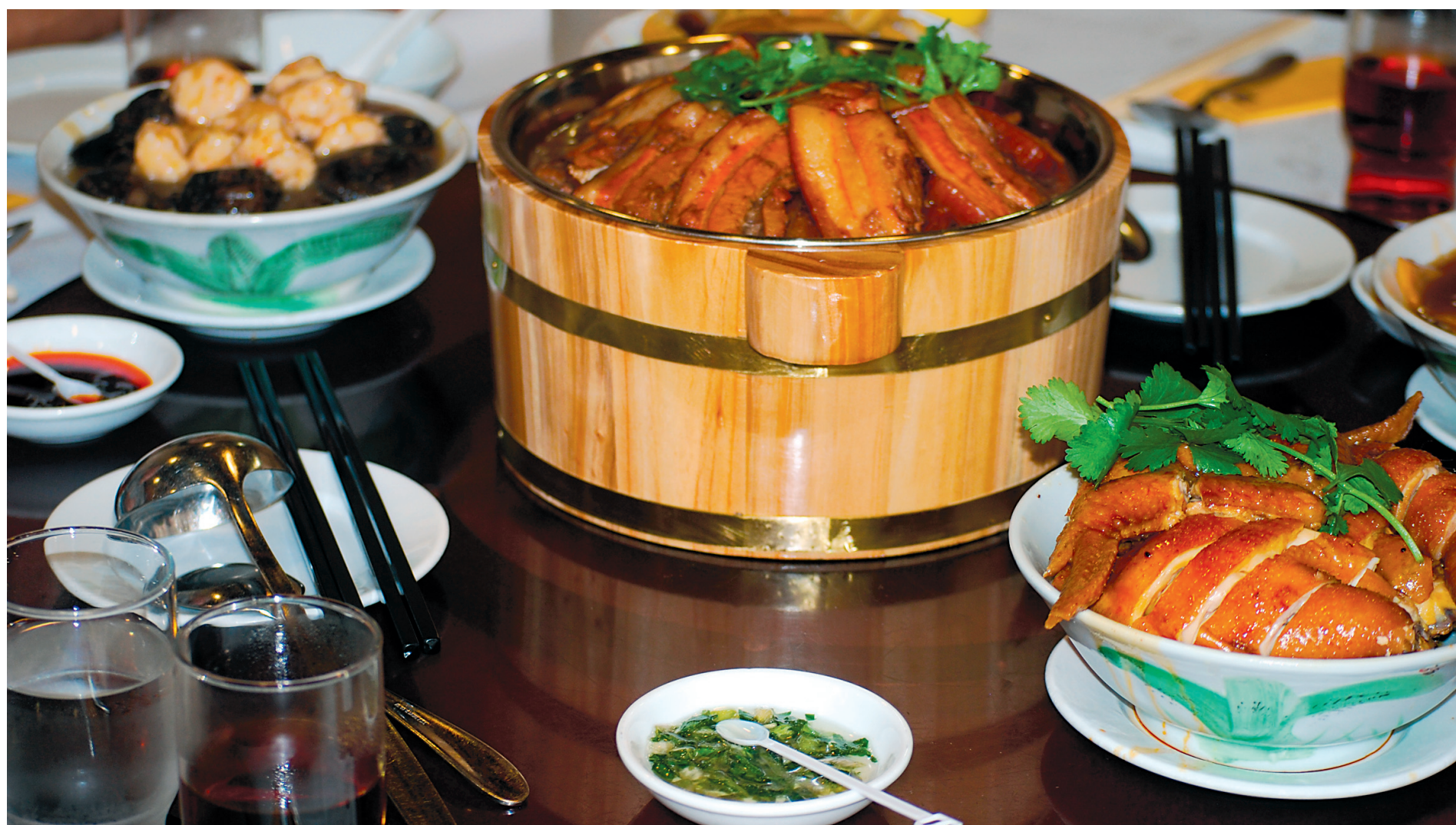
Les repas sont des rassemblements de la plus grande importance tant à la maison que dans les restaurants, qui sont pris d'assaut à cette époque du Nouvel An chinois, les réservations ayant parfois été faites plusieurs mois plus tôt. Ces repas peuvent souvent représenter jusqu'à 30% ou 40% du budget familial pour une année.

640 adresses toutes testées. Les restaurants de Paris sont regroupés par arrondissement. On y trouve aussi les restaurants ouverts tard le soir ou les fins de semaine. Cette 27 e édition s'avère un grand cru.