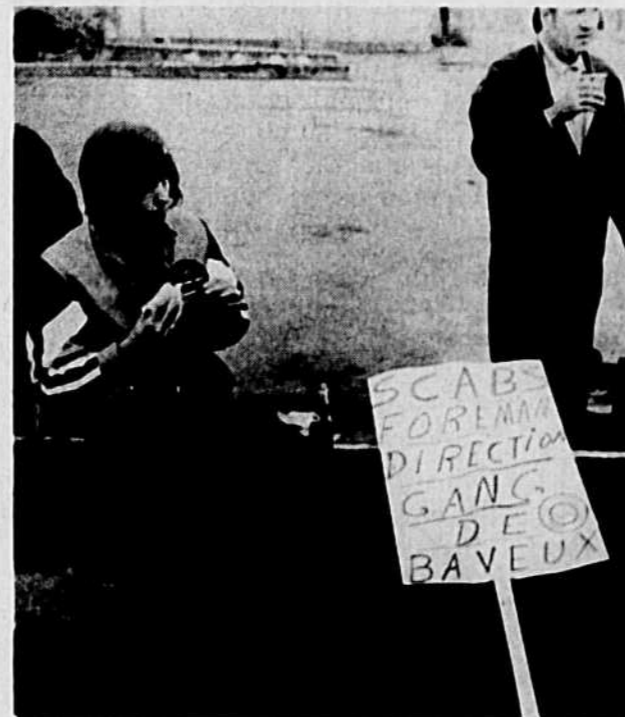
L'utilisation de scabs dans des conflits de travail mène inévitablement à des affrontements violents. L'utilisation de scabs, c'est la négation dans les faits du droit à la grève.

Si c'est vraiment l'intention du gouvernement d'interdire que le travail d'un salarié qui exerce son droit de grève soit effectué par une autre personne et s'il veut que toutes les entreprises soient traitées sur le même pied à cet égard, il doit faire en sorte que l'article 97a) couvre au moins les deux premiers cas que nous venons de mentionner: interdiction à un employeur de transférer son personnel d'une autre usine pour venir remplacer les salariés en grève ou en lock-out et interdiction d'utiliser le personnel de cadre ou le personnel non syndiqué ou non couvert par l'unité en grève pour effectuer le travail des salariés en grève ou en lock-out. Nous soulignons que ces deux points touchent avant tout les grandes entreprises et leur inclusion dans le projet de loi rétablirait un équilibre avec la situation des petites et moyennes entreprises.