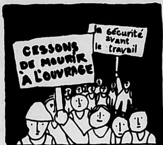
par Emile Boudreau, responsable du Service de Santé au travail de la FTQ.