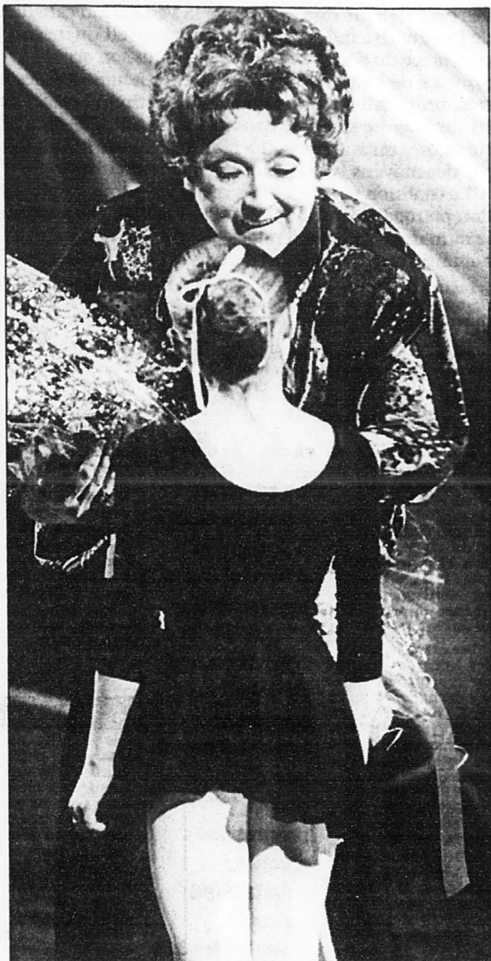
Hommage à « Madame » en 1987