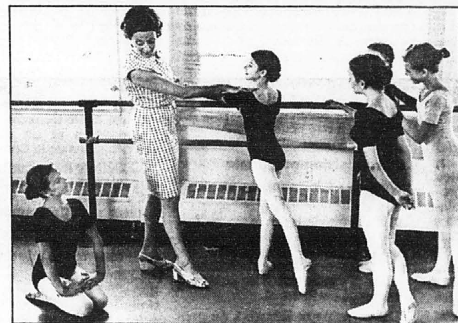
Une leçon en 1975