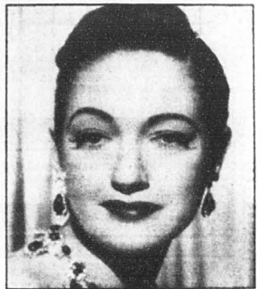
Dorothy Lamour dans toute sa splendeur.

Autrefois princesse de la jungle moulée dans un sarong ou souffre-douleur des piteuses de Bob Hope et de Bing Crosby, l'actrice Dorothy Lamour s'est éteinte à l'âge de 81 ans à son domicile de Hollywood. Les causes de son décès ne sont pas connues.