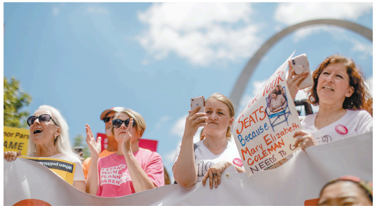
Des manifestants ont dénoncé la fermeture de la dernière clinique d'avortement à Saint Louis, Missouri, le 30 mai.