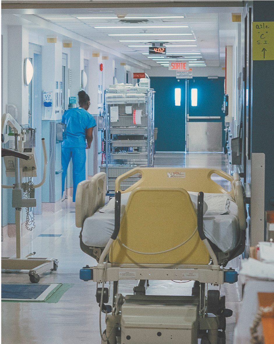
Le Québec compte un peu plus de 40 000 préposés aux bénéficiaires, surtout des femmes.

Il n'est question, sans arrêt, que des seuls bienfaits de la maternelle pour les enfants de quatre ans. Pourquoi ai-je l'impression que, depuis trop longtemps, l'éducation chez nous reste confinée à pareil placard de la pensée ?