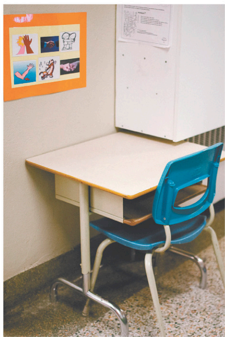
La pénurie d'enseignants est à son comble.