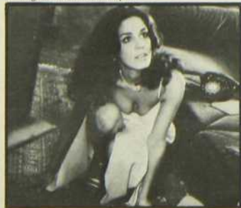
L'Argent de la banque

Caissier dans une banque de Toronto, Miles Gullen profite d'un hold-up commis par un voleur déguisé en Père Noël pour détourner à son profit une somme assez importante. Nul ne s'aperçoit de l'affaire, à l'exception du bandit, un certain Reikle, qui s'en prend alors à Gullen et le somme de partager le magot avec lui. Gullen imagine un stratagème pour faire emprisonner Reikle qui charge une amie, Elaine, de s'attacher au caissier pour le faire parler. Perdant confiance en Elaine, Reikle s'évade et tue sa complice. Une confrontation décisive s'ensuit entre le caissier et le criminel.