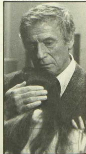
Clair de femme