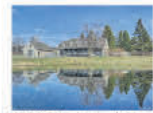
MELBOURNE , domaine de 80 acres, maison spacieuse, écurie 5 stalles, entrepôt à machinerie, garage, lac, 850 000$ Nouveau prix!