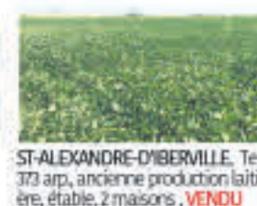
ST-ALEXANDRE-D'IBERVILLE , Terre 373 arp., ancienne production laitière, étable, 2 maisons, VENDU