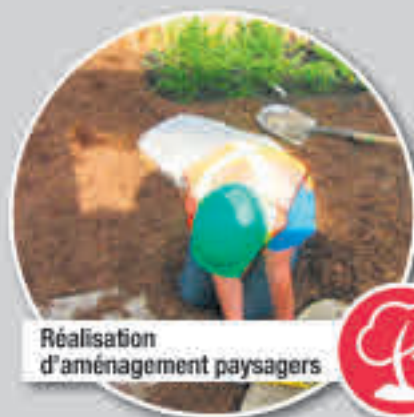
Réalisation d'aménagement paysagers