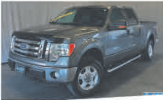
F-150 Super Crew 6'6 4X4 2011 69 510 km