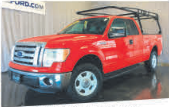
F-150 King Cab 2011 XLT 4X4 69 903 km