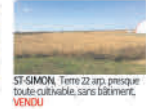
ST-SIMON , Terre 22 arp. presque toute cultivable, sans bâtiment, VENDU

DAVID COUTURE Ctr. imm., ing. agricole 450 525-0052