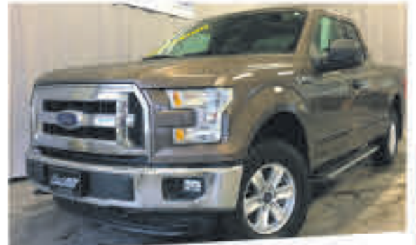
F-150 King Cab XLT 4X4 chrome pack 2015 21 479 km