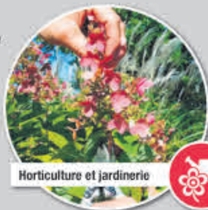
Horticulture et jardinerie

Pour mieux connaître les programmes offerts, vivez l'expérience Élève d'un jour pour vous aider à faire un choix encore plus éclairé ou pour vous inscrire! rendez-vous au epsh.qc.ca !