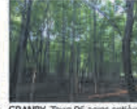
GRANBY , Terre 96 acres entièrement boisée, potentiel pour y aménager une érabièrerie +/- 2 000 entailles, 229 000$