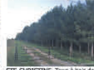
STE-CHRISTINE , Terre à bois de 58 acres, camps de chasse et plus, 189 000$