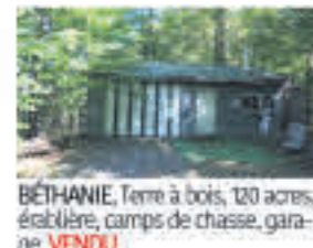
BÉTHANIE , Terre à bois, 120 acres, érabièrerie, camps de chasse, garage, VENDU