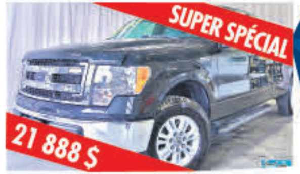
F-150 4X2 Super Cab long 2013 Bed XLT 81 124 km