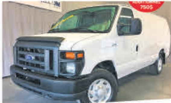
Econoline Cargo Van commercial 2014 69 676 km