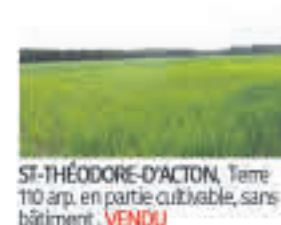
ST-THÉODORE-D'ACTON , Terre 110 arp. en partie cultivable, sans bâtiment, VENDU