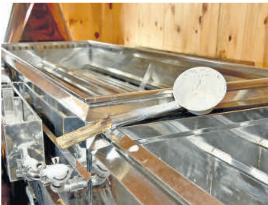
L'entaillage des érables de manière traditionnelle se fait plus tard dans la saison, contrairement aux producteurs qui utilisent les tubulures. Comme le trou ainsi créé s'assèche au fur et à mesure que la saison avance, affectant à la baisse la production d'eau d'érable, le tout se fait à la dernière minute.

public connaisse encore plus nos sirops d'érable, car oui, nous pouvons dire « nos » sirops. « Il y a une éducation qui doit être faite, même auprès des Québécois qui très souvent ne savent pas qu'il existe plusieurs catégories de sirop. Il faut apprendre à nuancer, à goûter mieux notre sirop et à utiliser les bonnes catégories selon qu'on sucre un dessert, rehausse des crêpes ou cuisine un plat de viande. Pour moi, cette folie-là, s'en est une de qualité du sirop avant tout, c'est une passion de l'érable qui m'habite », conclut M. Pollender.