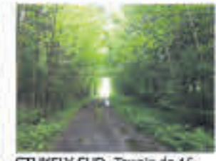
STUKELY-SUD , Terrain de 16 acres, droit de bâtir une maison, magnifique boisé d'érables, site idéal pour y aménager une fermette, loin de la route très privé, 145 000$