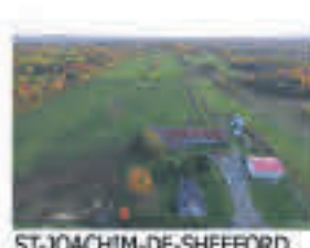
ST-JOACHIM-DE-SHEFFORD , Ferme de 64 acres dont +/- 50 cultivables, érabièrerie, maison rénovée, garage de mécanique, ancienne grange et plus, 359 000$