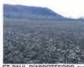
ST-PAUL-D'ABBOTSFORD aux limites de ST-PIE, Terre 79 arp. en partie drainée dont 63 arp. cultivables ASRA, sans bâtiment, 850 000$