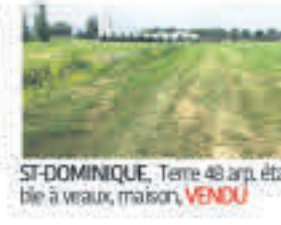
ST-DOMINIQUE , Terre 48 arp. étable à veaux, maison, VENDU