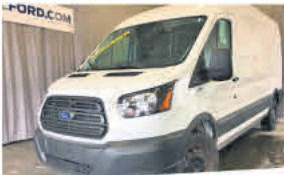
Transit Cargo Van Mid-Roof 2016 250 19 768 km