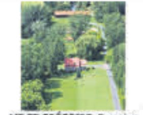
MT-ST-GRÉGOIRE , Domaine de 106 arp. dont +/- 20 cultivables, le reste boisé, jolie maison ayant beaucoup de boiseries, écurie 5 stalles et entrepôt adjacent, magnifique, 695 000$