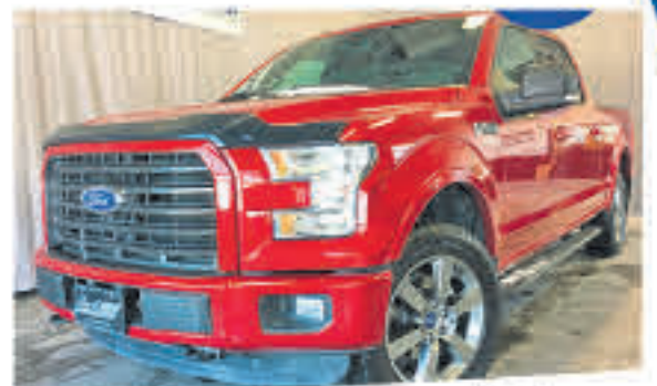
F-150 Super Crew Sport pack 2016 7084 km