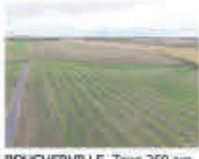
BOUCHERVILLE , Terre 250 arp. dont +/- 225 arp. sont cultivables et drainés, 3 145 000$