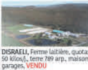
DISRAELI , Ferme laitière, quotas 50 kilos/j., terre 789 arp., maison, garages, VENDU