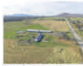
SHEFFORD , Terre 119 acres dont +/- 66 cultivables/prairie, étable, garage à machinerie, 395 000$