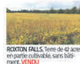
ROXTON FALLS , Terre de 42 acres, en partie cultivable, sans bâtiment, VENDU