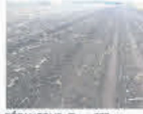
BÉCANCOUR , Terre 552 arp. dont +/- 350 arp. sont cultivables, loam argileux, grandes parcelles nivelées, 3 695 000$