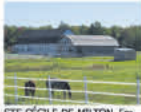
STE-CÉCILE-DE-MILTON , Fermette de 95 acres, prairie et boisé, bonne maison, écurie 7 stalles, étable, plusieurs endos et plus, 549 000$