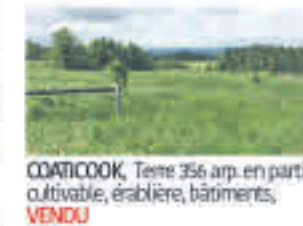
COATICOOK , Terre 356 arp. en partie cultivable, érabièrerie, bâtiments, VENDU