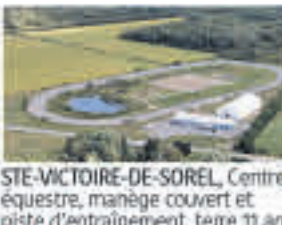
STE-VICTOIRE-DE-SOREL , Centre équestre, manège couvert et piste d'entraînement, terre 11 arp., VENDU