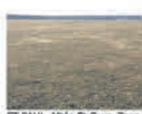
ST-PAUL , Mée St-Ours, Terre de 89 arp. dont +/- 79 cultivables, loam sablonneux, pas de roche, bon drainage naturel, sans bâtiment, 1 295 000$