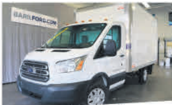
Transit Cutaway 2015 12 pieds, 33 457 km