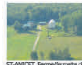
ST-ANICET , Ferme/fermette de 70 acres dont +/- 20 en prairie et culture, plantation d'argousiers, bonne maison rénovée, écurie, 375 000$