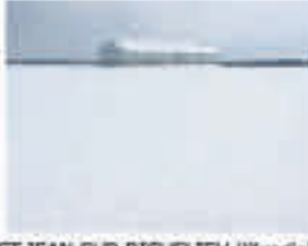
ST-JEAN-SUR-RICHELIEU (7% cadie), Terre de 284 arp. presque toute cultivable, drainée et nivelée, maison, 2 grands garages et plus, 4 695 000$