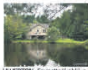
ULVERTON , Fermette/érabièrerie, 101 acres dont +/- 20 acres en prairie, +/- 2 500 à 3 000 entailles, 2 maisons, écurie, 3 garages, lacs, 645 000$