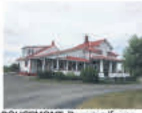
ROUGEMONT , Domaine/ferme, verger 45 acres, 7 600 pommiers, entrepôt réfrigéré 3 sections, atelier, remise à machinerie, maison spacieuse et luxueuse et plus, 1 295 000$