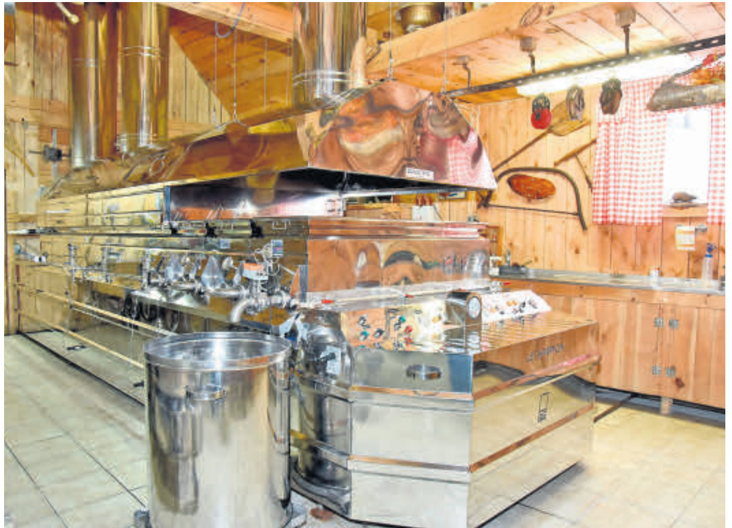
À l'Érablière Yamaska, charme champêtre et modernité se côtoient à merveille!

Pour ce faire, les équipements de M. Dumont se doivent d'être sans plomb, les savons utilisés pour le nettoyage doivent être exempts de produits chimiques et l'acériculteur doit respecter la dimension de ses érables et certaines profondeurs à l'entailage.