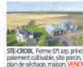
STE-CROIX , Ferme 571 arp., principalement cultivable, site porcin, plan de séchage, maison, VENDU