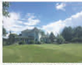
ST-PAUL-D'ABBOTSFORD , Domaine de 28 acres dont 18 cultivables drainés, verger 800 pommiers, maison impeccable, garage, vue sur la montagne et plus, 695 000$