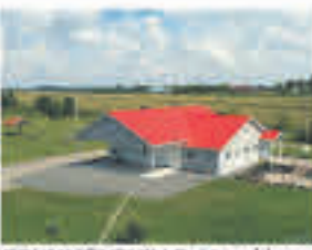
DRUMMONDVILLE , Vignoble en exploitation, certifié bio, terre 43 acres drainée, dont +/- 30 en culture céréalière, boutique, chal, atelier, équipement complet, maison luxueuse et plus, 1 075 000$