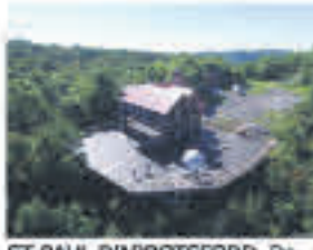
ST-PAUL-D'ABBOTSFORD , Domaine d'exception situé au sommet du mont Yamaska, grand chalet, terrain de 38 acres, érabièrerie et plus, 975 000$