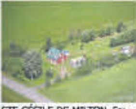
STE-CÉCILE-DE-MILTON , Fermette de 31 acres dont +/- 10 acres en prairie, le reste boisé, maison, 2 garages et plus, 329 000$