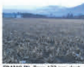
FRANKLIN , Terre 137 arp. dont +/- 70 cultivables, en partie drainée, beau loam sans roche, garage à machinerie, 575 000$