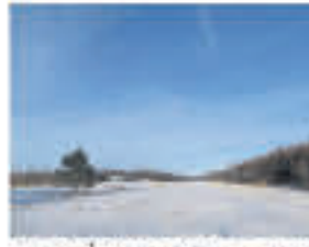
ST-EUGÈNE , Terre 95 acres dont +/- 20 cultivables drainés, le reste boisé, excellent secteur pour la chasse, 325 000$ Nouveau prix!