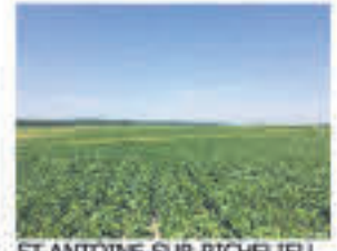
ST-ANTOINE-SUR-RICHELIEU , Ferme/fermette 39 arp. dont +/- 25 cultivables ASRA, loam argileux, vendue avec ou sans bâtiments, Terre 399 000$, ferme 699 000$