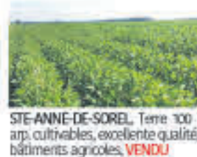
STE-ANNE-DE-SOREL , Terre 100 arp. cultivables, excellente qualité, bâtiments agricoles, VENDU