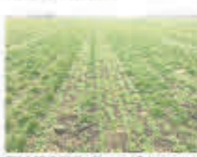
ST-LIBOIRE , Terre 134 arp. tout cultivable, drainée et nivelée, garage 50'x100', 2 195 000$