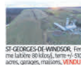
ST-GEORGES-DE-WINDSOR , Ferme laitière 80 kilos/j., terre +/- 510 acres, garages, maisons, VENDU