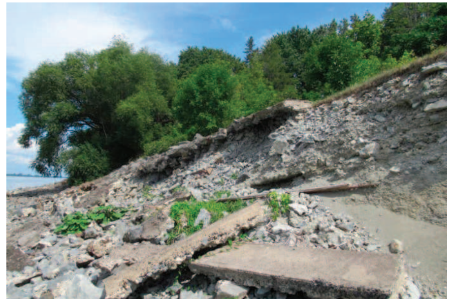
« Les experts nous apprennent que la situation est encore pire que ce qu'on croyait ! », s'est exclamé le député de Pierre-Boucher – Les Patriotes – Verchères, Xavier Barsalou-Duval.

Rappelons que le 8 octobre 2024, M. Barsalou-Duval avait provoqué un débat