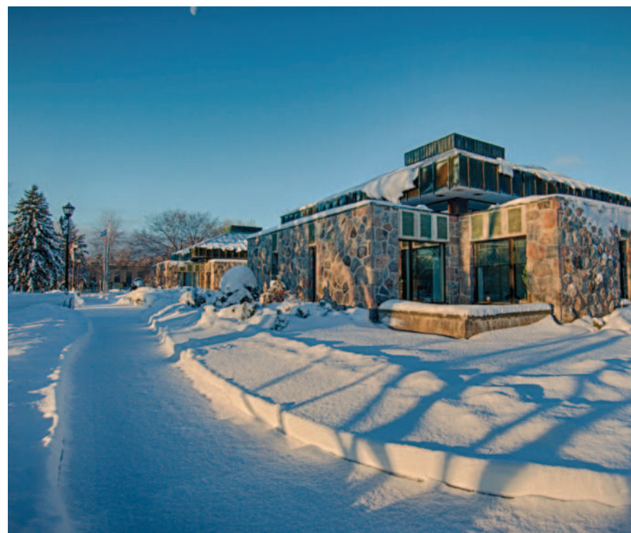
L'abolition de la Direction des communications signifie que ce service ne sera plus représenté à la table des directeurs des différents services municipaux.

Grâce à ces ajustements, la Ville a économisé environ 300 000 $ en 2024 dans la masse salariale. Pour 2025, elle vise des économies additionnelles de 150 000 $ à 250 000 $, notamment en maintenant un gel d'embauche.