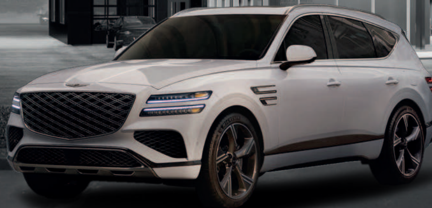
GENESIS GV80 2025

Plusieurs démonstrateurs 2023-2024 à liquider. Rabais pouvant aller jusqu'à 12 000$!