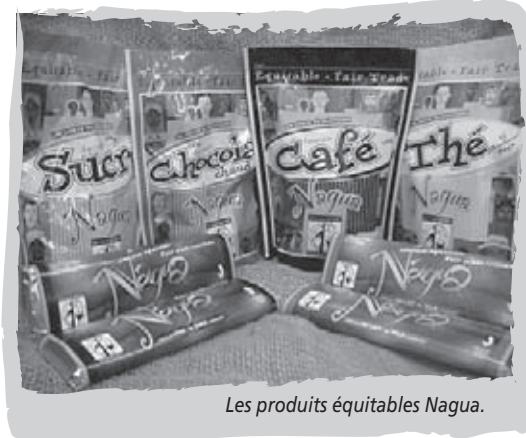
Les produits équitables Nagua.

>>> Défi 2008-2009 Dernièrement, le gouvernement du Québec a instauré une politique de saine alimentation dans les écoles. Dès le mois de mai, Plan Nagua fera la promotion de campagnes de financement 100 % équitables, lesquelles sont respectueuses des principes associés à une saine alimentation. Pour ce faire, nous élargirons la gamme de produits offerts afin d'allier le volet équitable à la santé. >>>