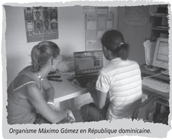
Organisme Máximo Gómez en République dominicaine.