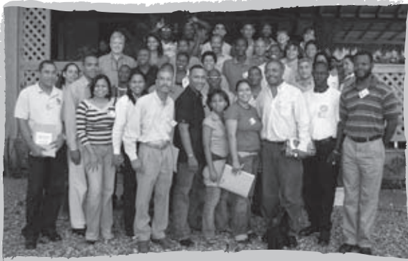
Le Collectif dominico-haïtien formé d'organismes partenaires haïtiens et dominicains de Plan Nagua.

L'équipe de coopération au siège social de Plan Nagua a quant à elle pour mandat d'effectuer le suivi et l'évaluation des projets en cours, en élaborant et en fournissant aux partenaires les outils nécessaires qui favorisent l'atteinte des objectifs associés à ces projets. Cette rétroaction est indispensable au bon fonctionnement de toute activité de coordination et de collaboration. Les divers séminaires, entrevues, évaluations institutionnelles et analyses réalisés dans le cadre de cette même dynamique d'échanges entre Plan Nagua et ses partenaires nous ont permis de cibler les domaines où notre collaboration est souhaitée. Voici une liste de ces domaines par catégorie :