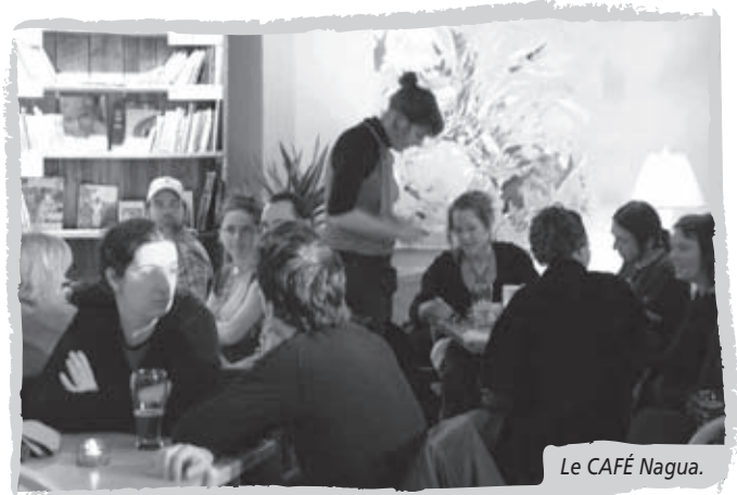
Le CAFÉ Nagua.