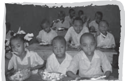
Élèves de l'École nationale mixte de Port-Margot en Haïti.

Investir dans la santé scolaire – La précarité des soins de santé et les carences nutritionnelles ont des répercussions indéniables sur l'éducation de base. Ainsi, de nombreux enfants traîneront toute leur vie des dommages mentaux et physiques qui influenceront leur développement personnel et leurs capacités d'apprentissage. Des études ont d'ailleurs montré que des enfants mal nourris qui manquent de soins sont voués à l'échec scolaire. Afin de tenir compte de ces facteurs prioritaires de réussite scolaire, Plan Nagua et ses partenaires se sont associés au Programme national des cantines scolaires afin de permettre à 6 350 enfants de recevoir un plat chaud chaque jour de classe. Les résultats atteints à ce jour sont agréablement surprenants. Des améliorations considérables ont notamment été remarquées sur le plan du taux de présence à l'école, des résultats académiques, de la participation des élèves aux activités de leur établissement et de la santé des enfants. Toutefois, les cantines scolaires ne sauraient à elles seules enrayer les séquelles causées par le manque d'aliments nutritifs sur une base régulière. La mise en place d'un volet plus large de santé scolaire s'inscrit ainsi dans les visées du projet afin de réunir les conditions essentielles à un apprentissage de qualité.