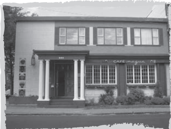
Le CAFÉ Nagua, situé au 990, 1 ère Avenue à Limoilou, a ouvert ses portes en juin 2007.

>>> Défi 2008-2009 Nous souhaitons atteindre le seuil de rentabilité, continuer de proposer des activités cohérentes en fonction de notre mission et intéressantes en vue de fidéliser la clientèle. L'investissement dans une terrasse pour maintenir l'achalandage pendant les mois d'été est également envisagé. >>>