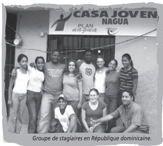
Groupe de stagiaires en République dominicaine.