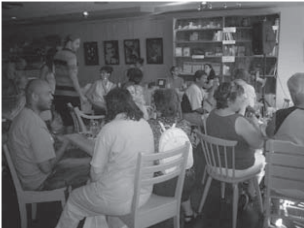
Ouverture officielle du CAFÉ Nagua en juin 2007.