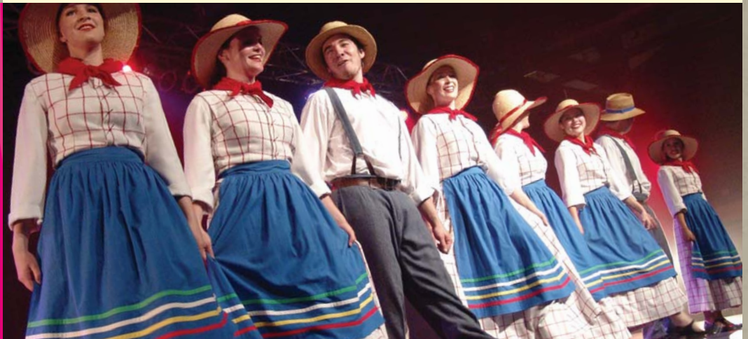
L'Ensemble folklorique Manigance au Festival Gigue en fête de Sainte-Marie, MRC de La Nouvelle-Beauce

La population de la Chaudière-Appalaches démontre un intérêt marqué pour les arts et la culture, l'histoire et le patrimoine, comparativement à d'autres régions.