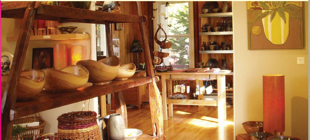
L'Atelier des Tourelles de Saint-Antoine-de-Tilly, MRC de Lotbinière

Le diagnostic culturel a permis de recenser les ressources disponibles dans la région susceptibles de dynamiser et de soutenir le développement culturel, en retenant là encore les points forts et les points faibles.