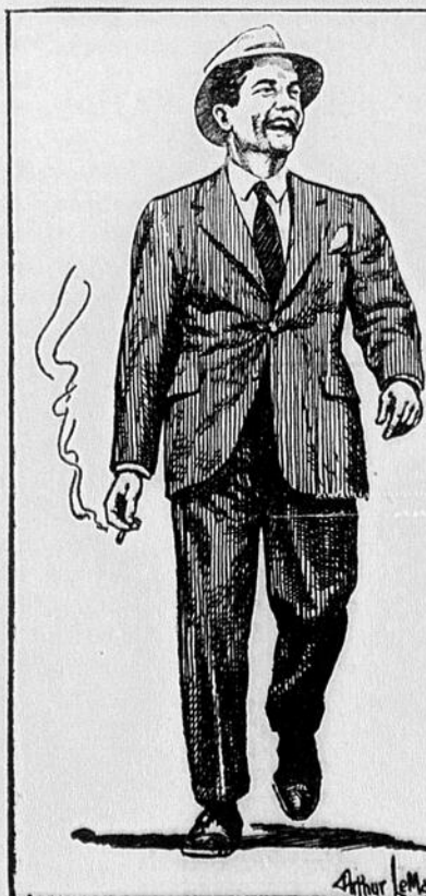
LA LIBERTÉ ?...