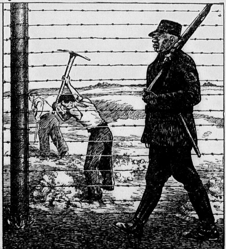
...LA SERVITUDE ?