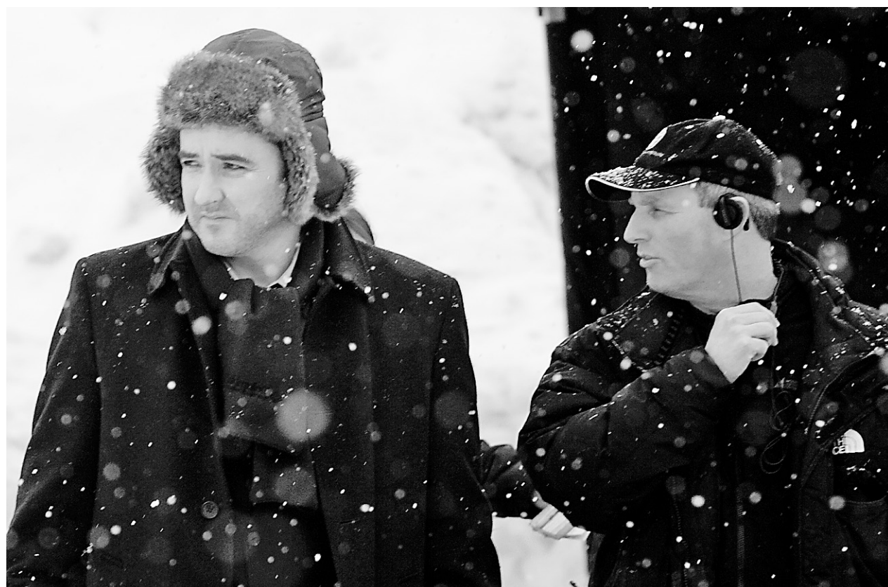
Le tournage du film américain The Factory , avec John Cusack, a eu lieu en février dernier à Montréal.

Certaines banques d'Hollywood ont même annulé leurs partenariats. Parmi eux, la banque allemande Deutsche Bank ainsi que la banque française Socié générale. « Dans des temps d'incertitude, il y a moins de capital à investir.