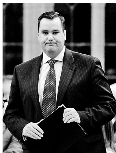
Le nouveau ministre du Patrimoine, James Moore, n'entend pas revenir sur les décisions prises par son prédécesseur Josée Verner.