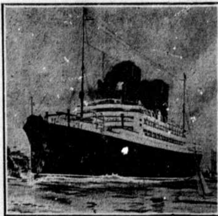
Le nouveau navire "Andonia".

LIVERPOOL, 8 rue Water, 1 rue Runford LONDRES, 51 Bishopgate, E.C. 29 Cockspur St. S.W. PARIS, 37 Boul. des Capucins.