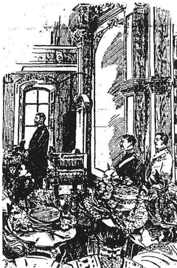
Prestation du serment de Charles-Alphonse Pelletier comme lieutenant-gouverneur, le 15 septembre 1908 ( Le Soleil , 16 septembre 1908).