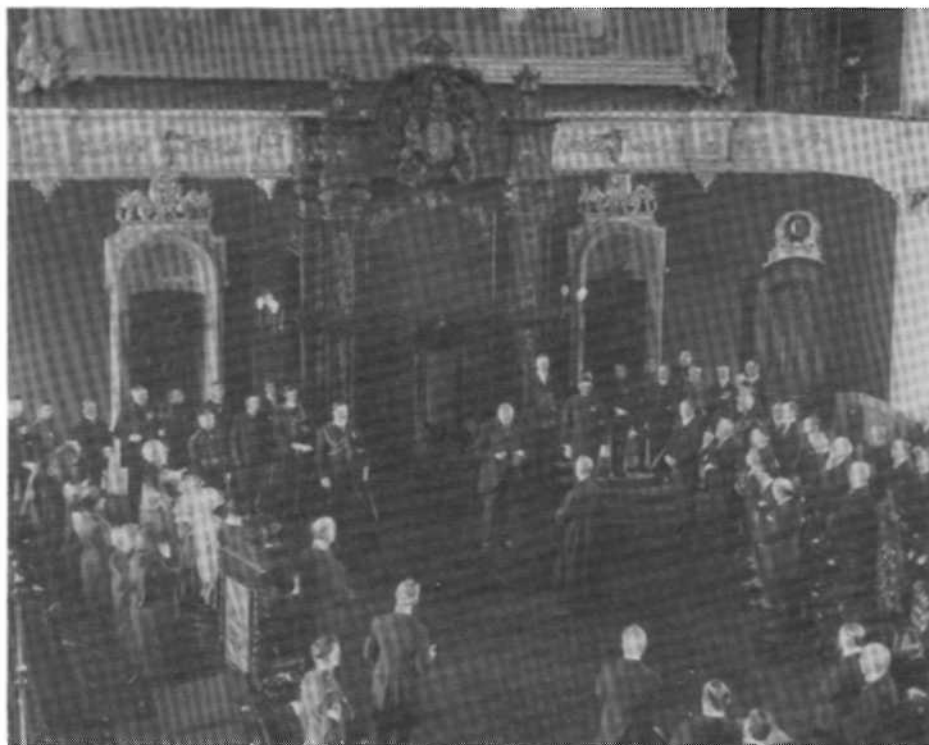
Assermentation de Louis-Philippe Brodeur comme lieutenant-gouverneur, le 31 octobre 1923.

La cérémonie se déroule le plus souvent dans la salle du Conseil législatif où l'on peut accueillir plus d'invités et déployer toute la pompe rituelle. Quand elle a un caractère plus intime, on choisit la salle du Conseil exécutif ou un autre salon de l'Hôtel du Parlement. Qu'elle soit solennelle ou non, la cérémonie comprend alors les étapes suivantes : l'arrivée du nouveau titulaire, la lecture et la remise de la commission, la prestation