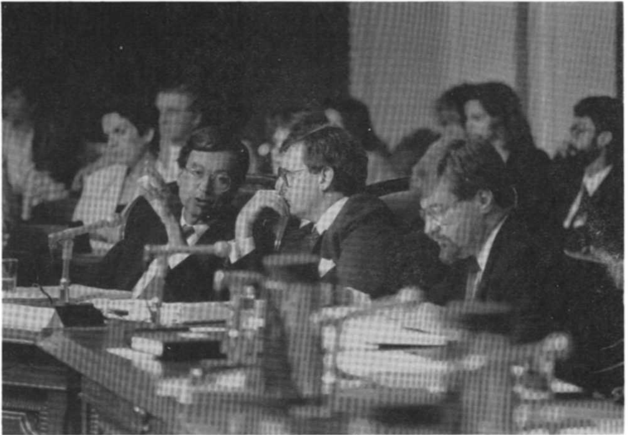
Le premier ministre à la Commission parlementaire qui a étudié le libre-échange (Coll. MCQ).

cheurs au Québec. Le gouvernement jugeait que leurs activités étaient peu importantes et qu'elles n'entraînaient pas le même genre de problème qu'à Ottawa. Ici, les entreprises commerciales et les syndicats agissent directement, de l'avis de cet adjoint (7) .