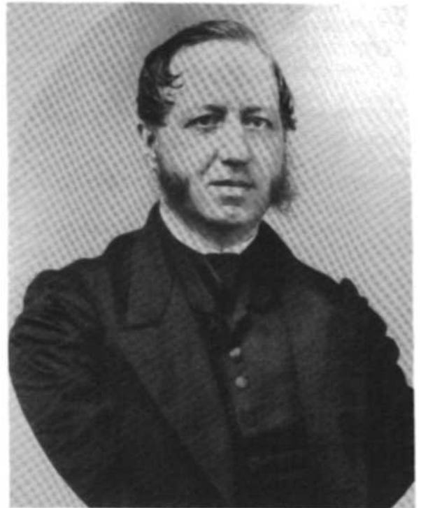
Pierre-Joseph-Olivier Chauveau, le 1 er premier ministre du Québec (1867-1873).

Jeune avocat de Québec, Chauveau s'oppose avec force à l'Union des deux Canadas en 1840. Ses idées et ses prises de position l'attirent de plus en plus vers l'arène politique.