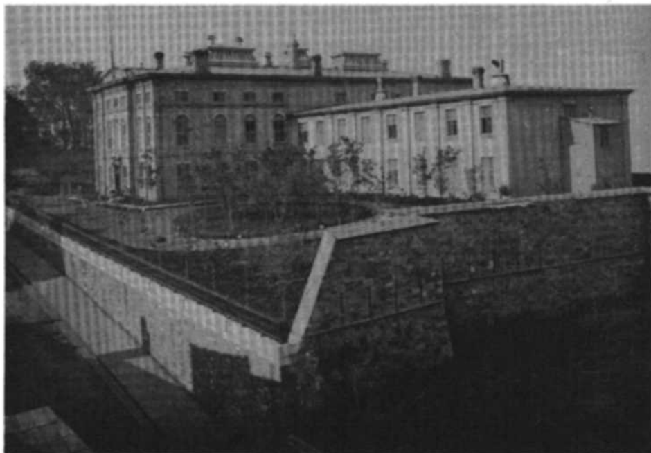
Édifice du Parlement dans lequel a siégé M. Chauveau.

P.-J.-O. Chauveau fut un homme honnête, c'est-à-dire probe, et un honnête homme, c'est-à-dire cultivé. S'il a laissé sa trace et inscrit son nom dans l'histoire, ce n'est pas parce qu'il transcende son époque, mais parce qu'il lui ressemble dans ce qu'elle a eu de meilleur.