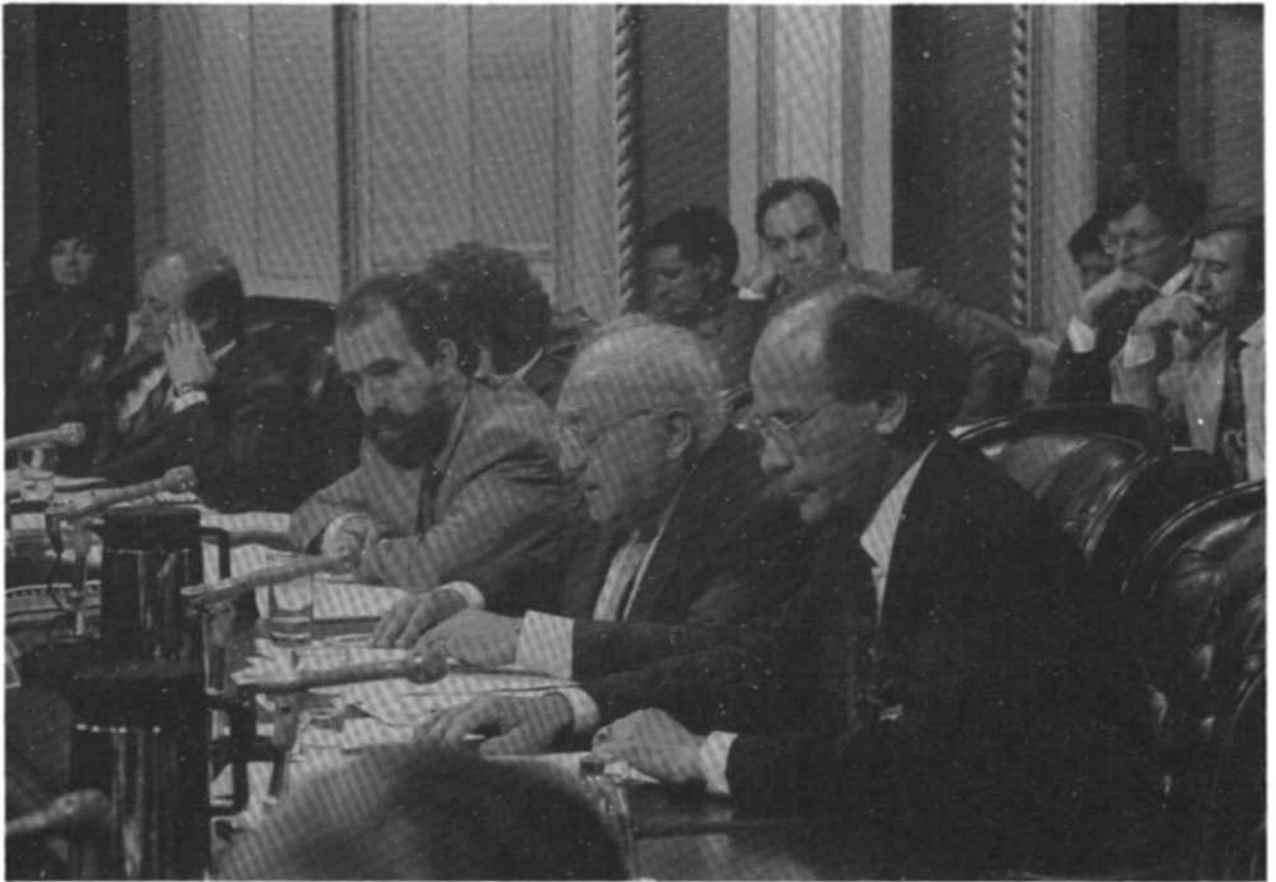
Témoignage de chefs syndicaux sur le libre-échange à la Commission de l'économie et du travail (juin 1988).

fédéral sur ses projets d'avenir, elle informe, elle conseille, elle peut parfaire la rédaction de mémoires à présenter aux comités parlementaires et figurer des documents pour les traduire dans «le langage des bureaucrates». Tout cela pour 3 000 $ à 10 000 $ par mois ou plus. Une trentaine d'employés à Ottawa, à Toronto et à Montréal assurent le suivi des dossiers.