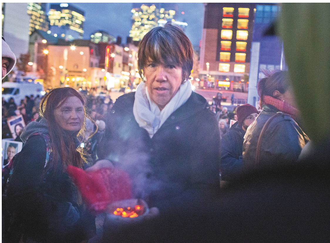
Sous des fumées de sauge, pancartes de femmes disparues ou assassinées s'agitant, plusieurs centaines de personnes ont tenu vigile jeudi soir, faisant déborder l'esplanade de la Place des Arts.