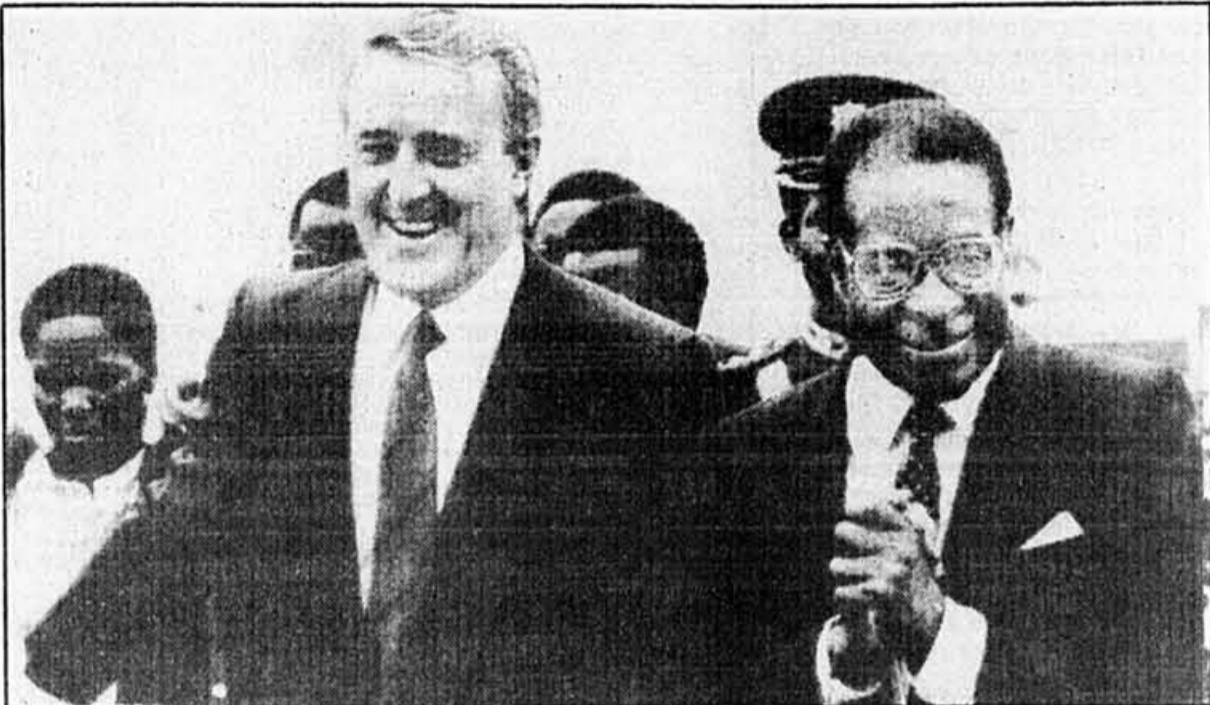
Le premier ministre canadien, M. Brian Mulroney, a été accueilli par son homologue du Zimbabwe, M. Robert Mugabe, hier à Harare.

C'est pourquoi une dizaine de membres du PC se réuniront aujourd'hui dans le but de relancer le débat sur le financement au sein du PC.