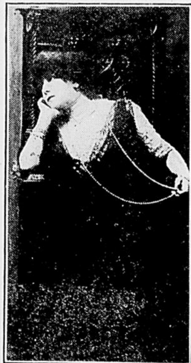
SARAH BERNHARDT, au National la semaine prochaine.