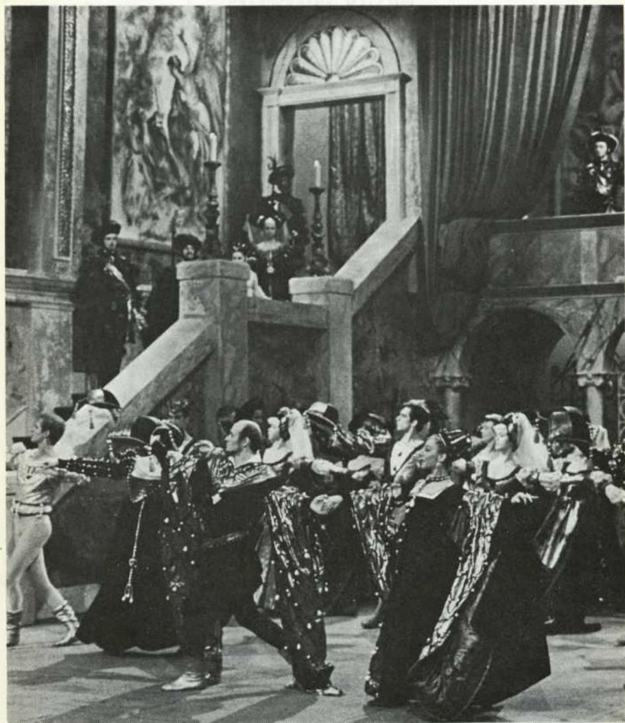
Le Ballet National du Canada Roméo et Juliette — Acte II

The National Ballet of Canada Romeo and Juliet — Act II