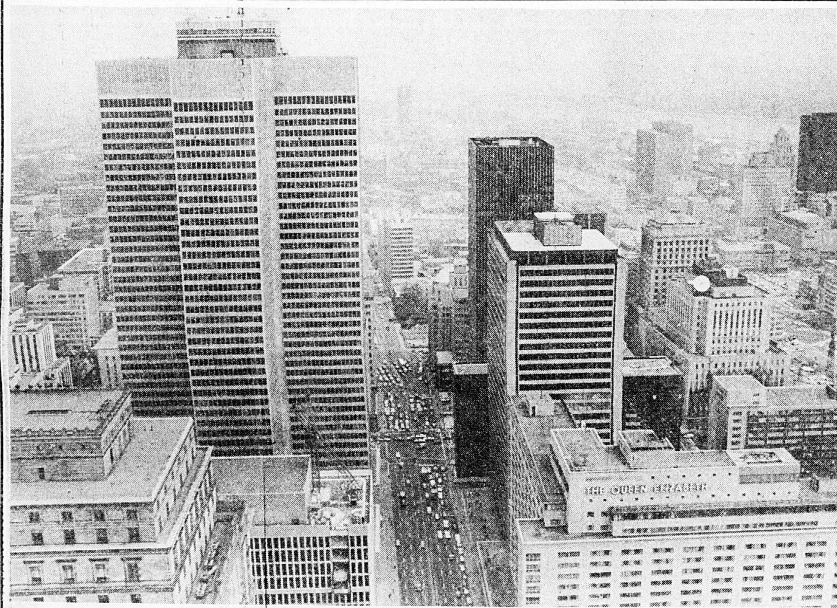
En regardant vers le pont Jacques-Cartier, de l'observatoire de l'édifice de la Banque Impériale de Commerce, au 45e étage.