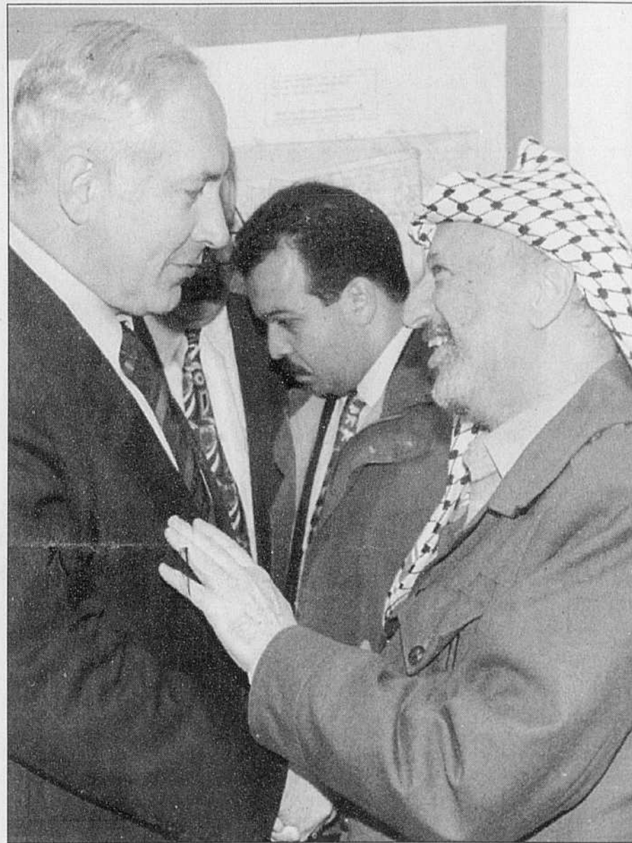
Benjamin Nétanyahou a confié à Yasser Arafat au début de leur rencontre: «Nous allons terminer cela cette nuit.» Arafat lui a répondu: «Je suis avec vous jusqu'au matin, et oui, nous allons terminer cela cette nuit.» Deux heures plus tard, l'entente était paraphée par les négociateurs en chef, le Palestinien Saëb Erakat et l'Israélien Dan Shomron.