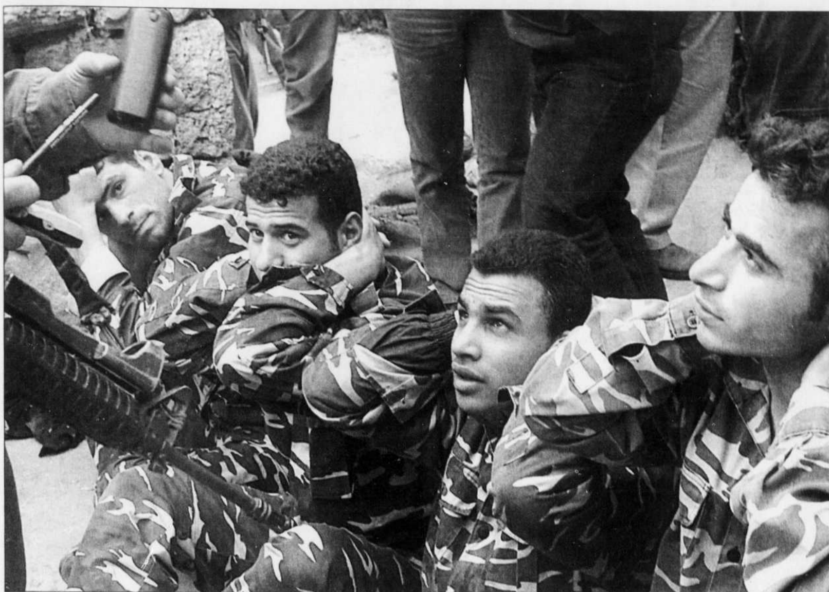
L'armée israélienne surveille un groupe de policiers palestiniens arrêtés lors de l'encerclement des bureaux de Yasser Arafat, à Ramallah. Selon les sondages, plusieurs Israéliens ont compris que la stratégie d'Ariel Sharon visant à obtenir la sécurité par la force est vouée à l'échec.

Lettre ouverte au premier ministre Jean Chrétien et au ministre des Affaires étrangères Bill Graham