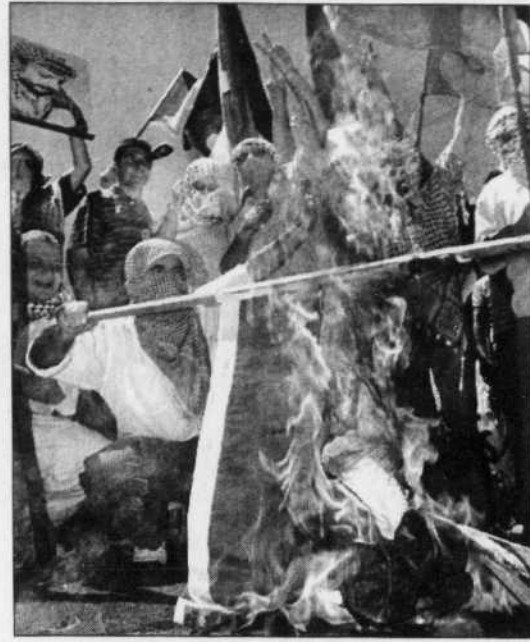
Un drapeau israélien brûle devant l'ambassade d'Israël à Brasilia. Des milliers de manifestants pro-palestiniens ont dénoncé l'action d'Israël.

suicide menés par un groupe proche de son mouvement, le Fatah.